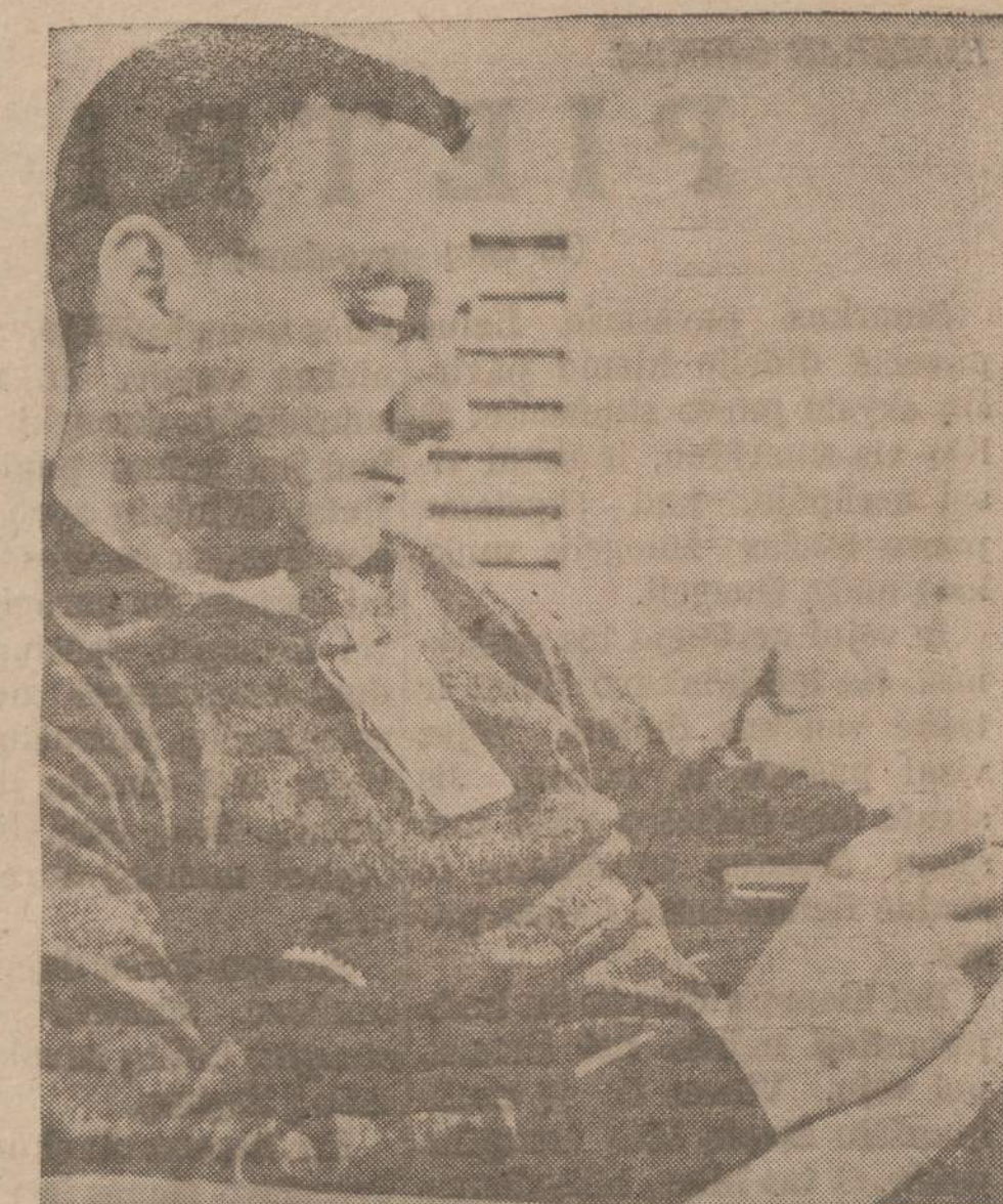
Astronautas Virgil Grissom. — Astronautas Virgil I. Grissom turėjo skristi į erdvę antradienį, bet dėl blogo oro skridimas teko atidėti ir praėjusį penktadienį jis savo žygi atliko sėkmingai.

7 — NAUJENOS, CHICAGO 8, ILL. — SATURDAY, JULY 22, 1961