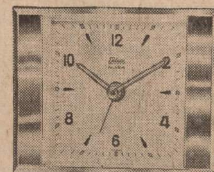
Žalvariu apjuosti žvilgančių rodyklių žadintuvai.