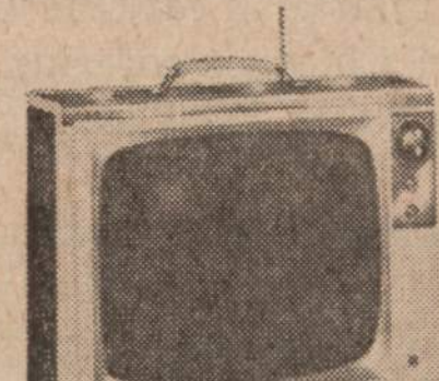
Nešiojama 19" Admiral televizija.

Tinkamai įremuota 20" x 24" Utrillo garsų "Montmartre Sacre Coeur" aliejinės tapybos paveikslą.