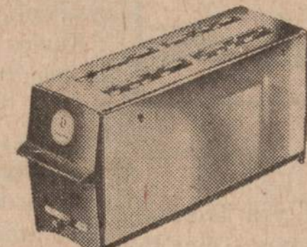
Dormer 4 iškokančių riekiųjų skrudintuvą.

Tinkamai įremuota 20" x 24" Utrillo garsų "Montmartre Sacre Coeur" aliejinės tapybos paveikslą.