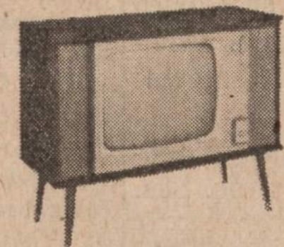
23" Zenith TV su tolimos kontrolės Space Command.

Be to, dar esame pasiryžę išdalyti šias vertingas dovanas žmonėms, kurie atidarys $50 sąskaitą arba tokią sumą pridės prie jau turimos. Kaip šias dovanas gauti, patirsite užėję pas mus. Štai dalinamos dovanos: