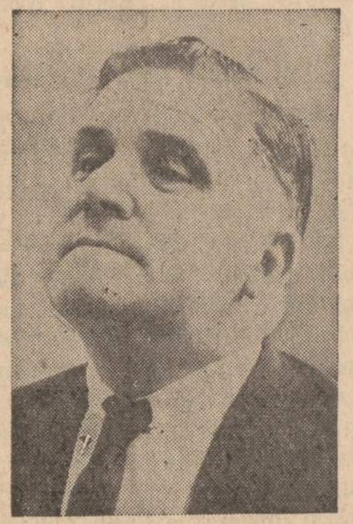
James E. Webb, JAV erdvės ir aeronautikos agentūros administratorius, paneigė sovietų laikraščio kaltinimą, kad Amerikos Midas yra "šnipinėjimo satelitas". Senato vyriausybės operacijų pakomitečiui Webb pareiškė, kad Midas nėra aprūpintas šnipinėjimo kameromis.

Pagaliumi Illinois valstybės le-gislatūra priėmė bilių, kuris draudžia miesto savivaldybėms reikalauti, kad ant pardavinėjamo pienui būtų dedamos datos, menamai rodančios pienui senumą. Gubernatorius Kerner po tuo biliu pasirašė. Tuo būdu menamas pardavinėjamo pienui senumas Chicagoje nebebus žymimas.