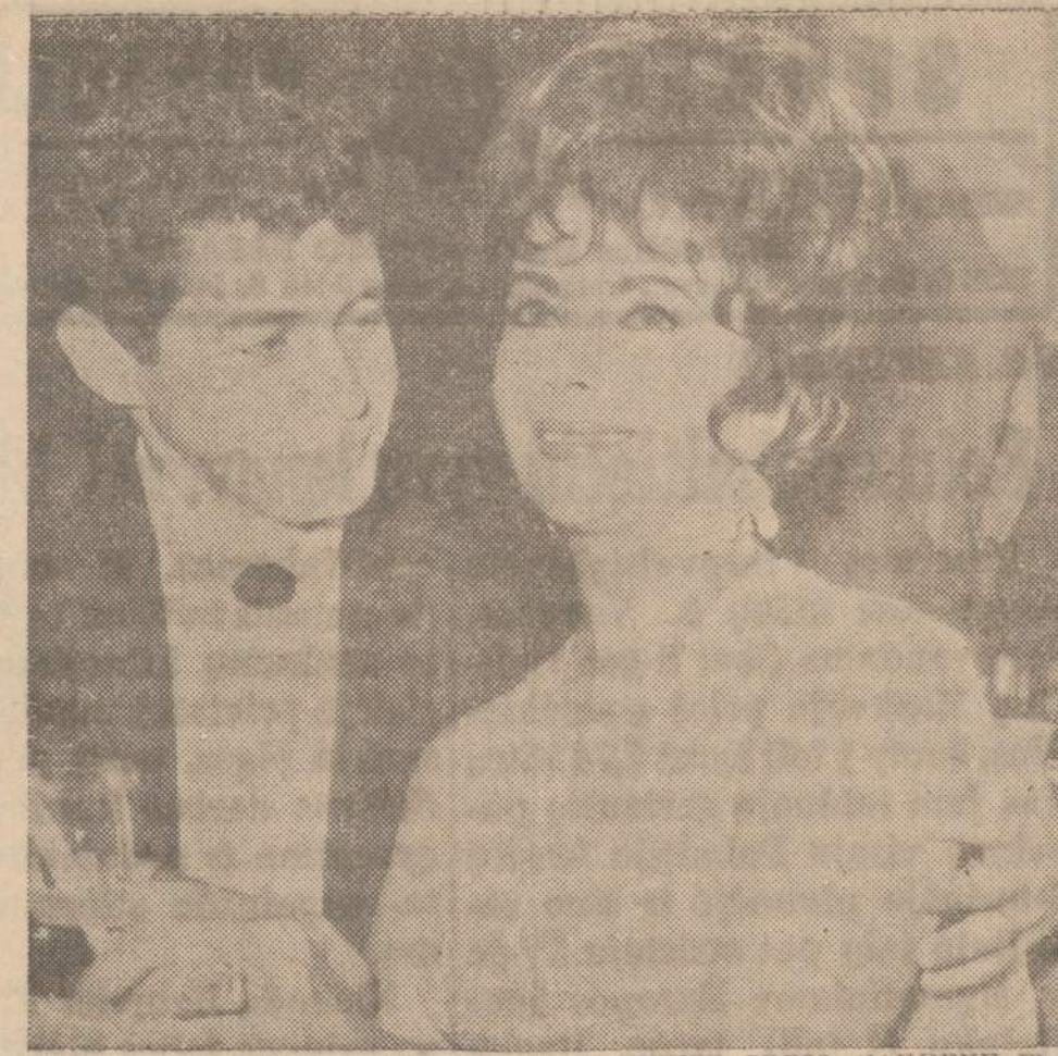
Aktorė Elizabeth Taylor su savo vyru Eddie Fisher Los Angeles miesto Coconut Grove. Ant aktorės kaklo matosi bandža. Tai paseka operacijos, kurios tikslas buvo pašalinti ankščiau padarytos operacijos randus.

BIZNIERIAI, KURIE GARSINASI “NAUJIENOSE” — TURI GERIAUSIA PASISEKIMĄ BIZNYJE — GARSINKIS IR TU