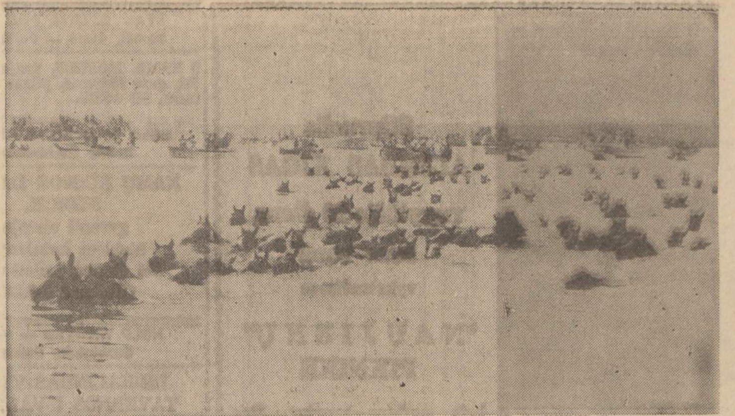
Laikraščiai poniai (maži arkliukai) plačiai išplatinti iš Assispego salos į Chicago, Va. Kiekvienais metais savanoriai ugniagesiai sugrunda poniai ir parduoda juos į Vakarų Vyh. Už gautus pinigus išsilygia gaisrų gesinimo įrankius. Poniai gaudymas ir jų pardavinėjimas iš Vakarų Vyh prasidėjo prieš 60 metų. Kiek žinoma, poniai atsirado saloje prieš kelius šimtmecius. Manoma, kad jie ir tą salą pateko iš vieno skandinavų ispanų laivo.

"NAUJIENAS" SKAITO VISU SROVŲ ŽMONES: DARBININKAI, MOKSLININKAI, VALSTYBININKAI, DVASININKAI, PROFESIONALAI IR BIZNIERIAI. JIE ŽINO, KAD NAUJIENOS PADUODA TEISINGIAUSIAS ŽINIAS IR GERIAUSIUS RAŠTUS.