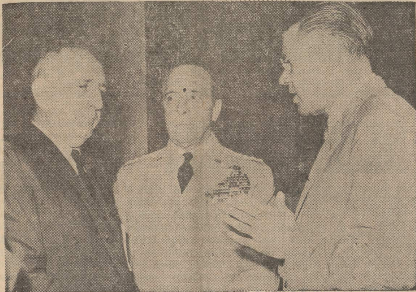
Gynbos sekretorius Robert McNamara (dešinėje) ir generolas Lyman Lemnitzer, štabo viršininkų tarybos pirmininkas (viduryje), buvo pašaukti į senato gynbos reikalų pakomitečio posėdį. Jie kalbasi su senatoriu Richard B. Russell, komiteto pirmininku.

(E) Prieš penkis metus Sovietų Sąjungai priėmus valstybinį pensijų įstatymą, dabar džiūgaujama, kad tai įrodė didelę partijos ir vyriausybės dėmesį socialiniam aprūpinimui. Išleistas tų įstatymą Lietuvoje pensininkų skaičius pakilęs dvigubai. 1956 m. sausio 1 d. pensijas Lietuvoje yra gavę 51.717 žmonių, o 1961 m. sausio 1 d. pensininkų skaičius padidėjo iki 111,206 žmonių. Senatvės pensininkų skaičius padidėjo nuo 9,250 iki 35,093 žmonių. 1961 metais valstybinėms pensijoms paskirta 32,254,000 rublių naujais pinigais. Minėdamas pensijų įstatymo 5 metų sukaktį, Vilniaus radijas ir spaudoje nežodžiu ne užsiminė apie pensijų dydį, nė apie tai, ar iš kuklių 10-12 rublių pensijos gali žmoniškai pragyventi Lietuvos gyventojas.