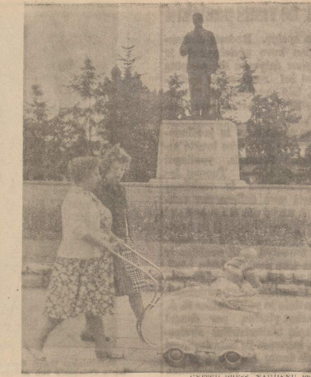
Motina stumia vežimėlį Stalino alėja rytų Berlyne. Motosi Stalino statula, ant kurios nėra lentelės su parašu. 1953 metų sukilimo metu sukilėliai tą lentelę nuplėšė, ir iki šiol niekas nedrįso uždėti naują.

Po parado užsienio diplomatai yra Hitlerio svečiai Potsdame, o vakare v. Ribbentrop