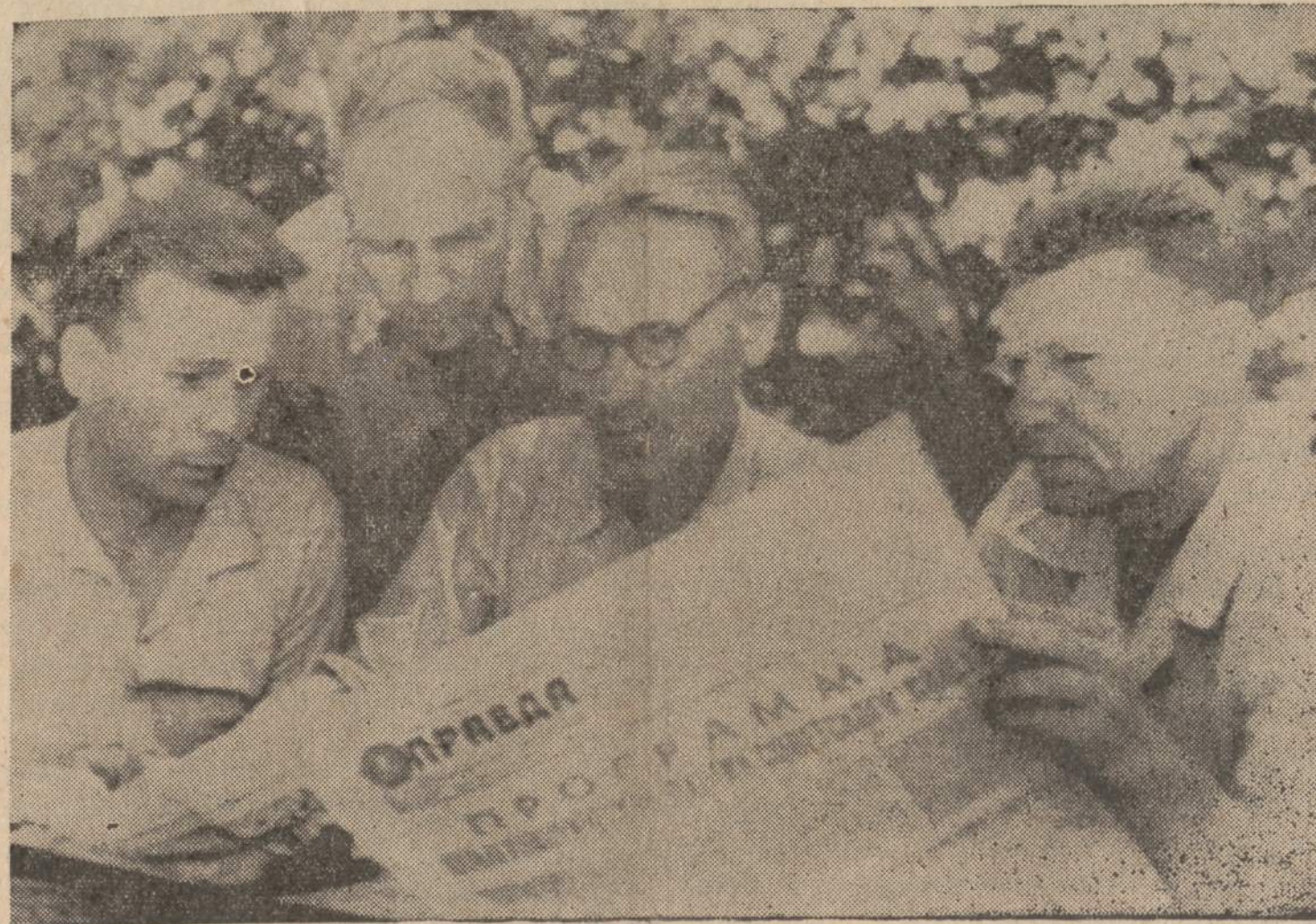
Sovietų piliečiai skaito "Pravdą", kur paskelbta naujoji komunistų partijos programa. Per 20 metų žada sukurti Rusijoje tikrą rojų.

— Robert Kennedy, vyriausias prokuroras, atstovaus savo broliui, JAV prezidentui, Dramblio Kaulo Pakrantės respublikos pirmųjų nepriklausomybės metinių minėjime rugpjūčio 6 dieną.