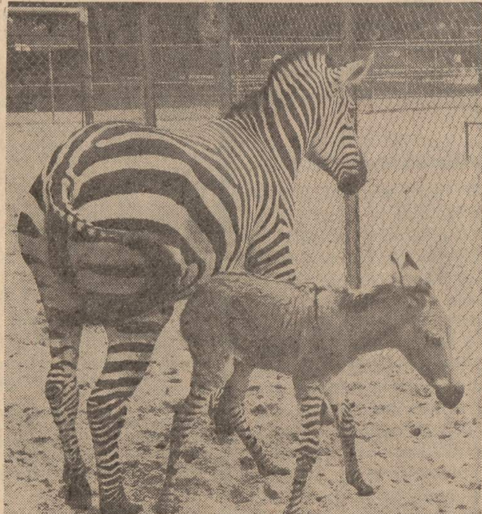
Madison, Wisc. — Vilas Park zoologijos sodą pareigūnai turi nemažą galvosūkių, kaip pavadinti 55 svarų naujagimį, kurio motina yra zebra, o tėvas — asilas. Naujagimis iš motinos paveldėjo kojas, o kitais atžvilgiais yra labiau panašus į asilą.

Į O'Hare aerodromą kiekvieną dieną atskrenda lėktuvai iš įvairiausių kraštų. Tais lėktuvais atskrenda įvairių kraštų žmonės, atsiveždami įvairiausių daiktų. Tiek tie daiktai, tiek iš svetimų kraštų grįžtančių amerikiečių daiktai turi būti prežiūrimi muitinėje, kuri veikia prie aerodromo. Iki šiol totį muitinė nebuvo tinkamai sutvarkyta ir keliautojams tekdavo bereikalingai daug laiko sugaišti. Dabar muitinė yra taip sutvarkyta, jog veikia labai sklandžiai: įvežami iš kitų valstybių daiktai yra greit peržiūrimi ir svetimų valstybių