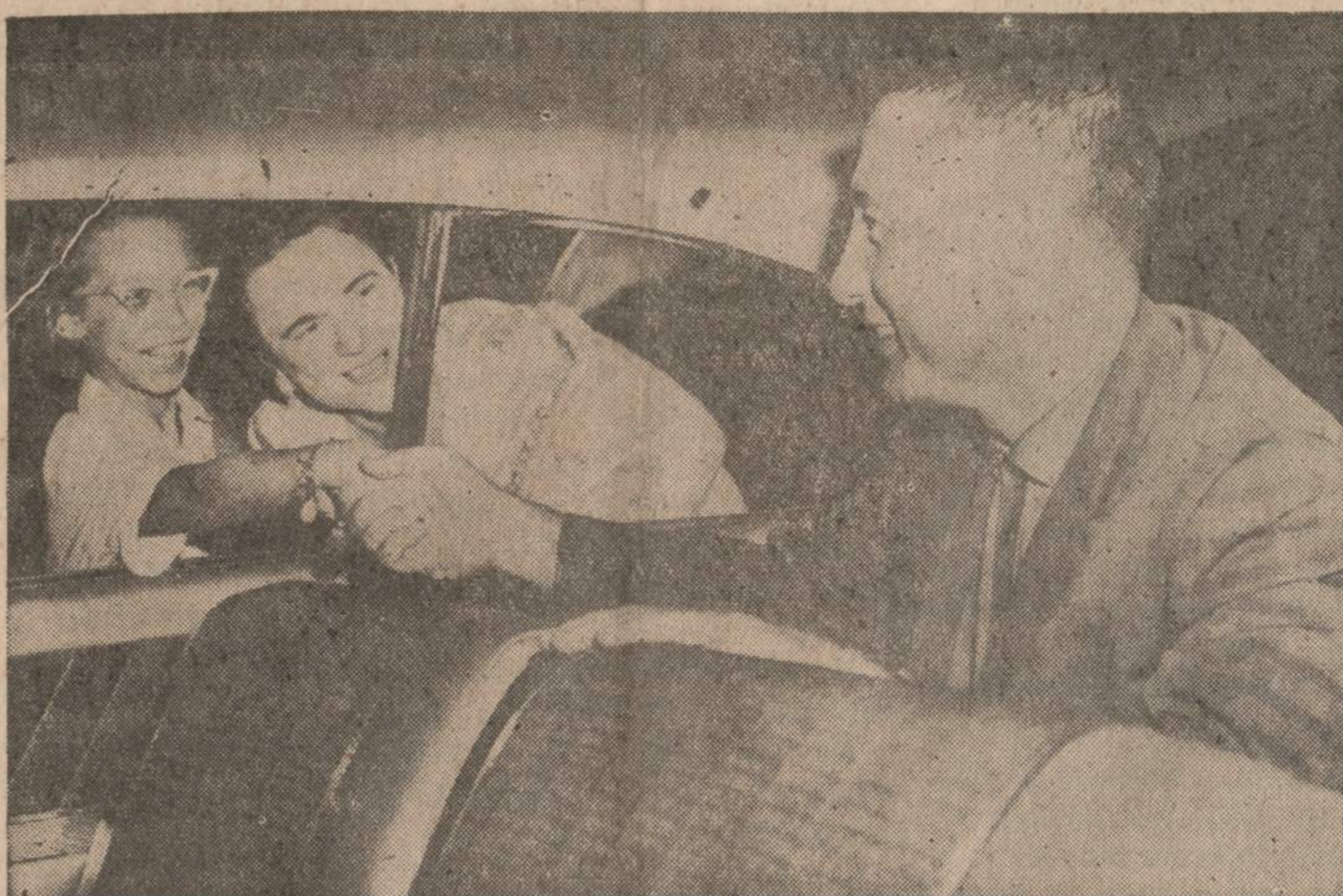
Astronautas Virgil Grissom entuziastiškai pasitinka naujūolius San Antonio (Texas) aerodrome. Jis buvo vienas iš penkių astronautų, kurie atvyko į San Antonio.

Dulles ir jo pavaduotojas gen. Richard Bissell greit pasitrauks į atsargą. Po to bus pravesť jų slaptojoji įstaigoj minėtos formos.