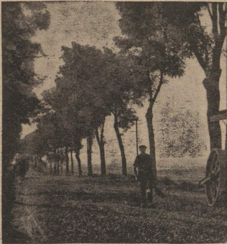
Kelias — vieškelis mūs, veda mus — į namus...