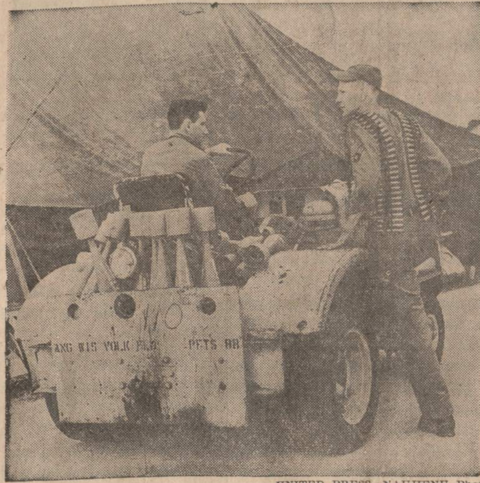
Illinois oro nacionalinės sargybos 170-to eskadrono nariai ruošiasi gabenti amuniciją ir lėktuvą. Jie atlieka dviejų savaitių treniruotę Volk Fielde, Wisconsin valstybėje.

— Ketvirtadienio vakarą buvo paleistas Discoverer satelitas, No. 28. Bet orbiton nepateko.