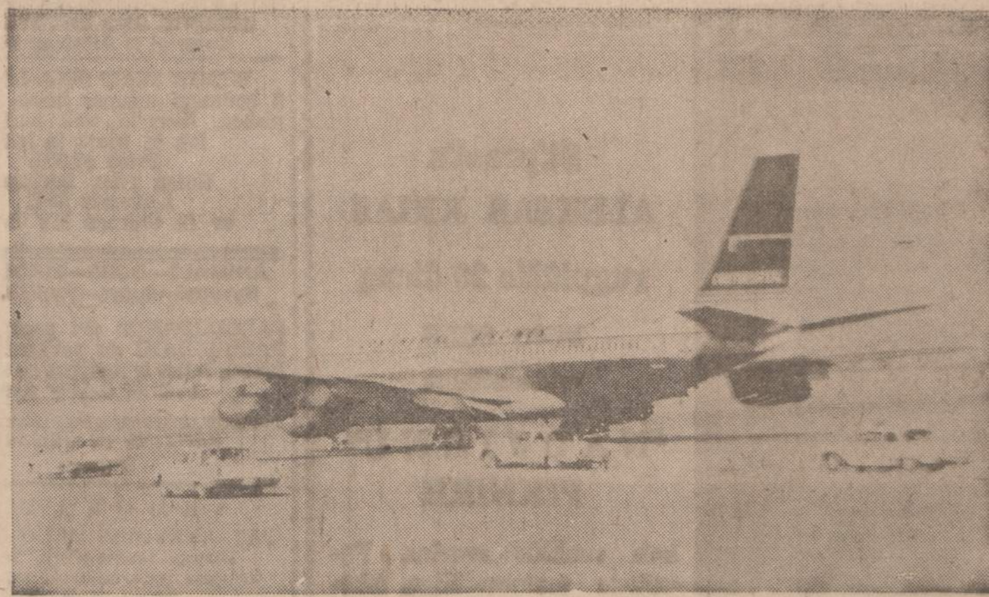
Saugumo agentai, keturiais automobiliais važiuodami, žaudo į Kontinentalės linijos 707 spausminio lėktuvo padangas, kad jis negalėtų pakilti. Tai įvyko El Paso (Tex.) aerodrome, kai du ginčluoti vyrai, pasilikę lakūnus įkaitais, bandė juos priversti, kad jie skristų į Kubą.