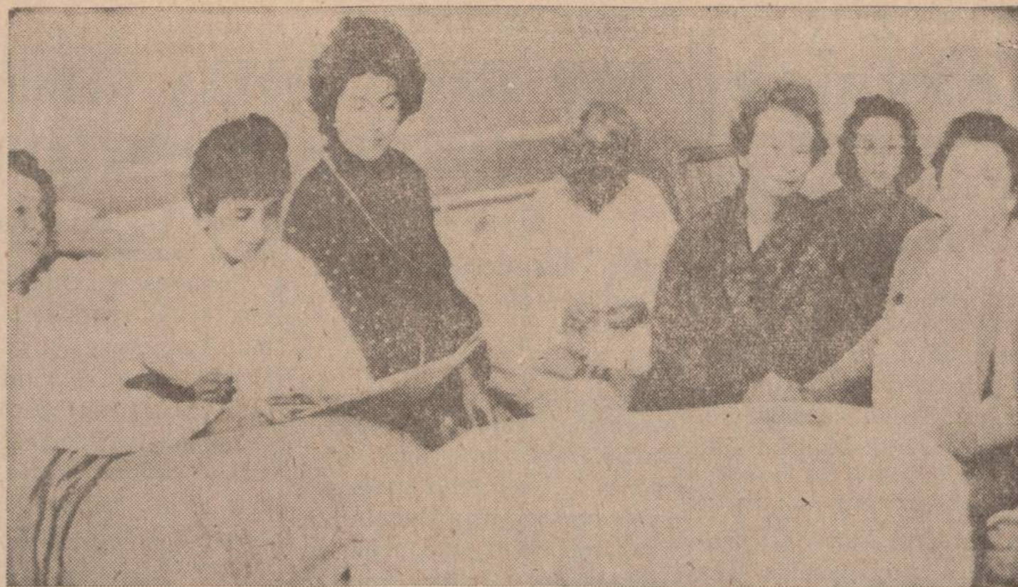
Septynios amerikietės Zjuricho (Šveicarijoje) ligininėje skaito laikraštį, kur aprašyta šiurpulinga autobusų nelaimė. Jos buvo vienos iš 19 turistų, kurios važiuo tuo autobusu ir išliko gyvos, kai autobusas nusirio į Lucernos ežerą. Šešiolika kitų keleivių žuvo toje nelaimėje.