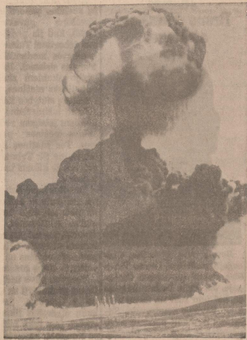
Suffield tyrimo stotyje (ji yra Medicine Hat, Albertos provincijoje, Kanadoje) mokslininkai išsprogina šimta tonų TNT sprogdinčias medžiagas, kad galėtų patirti, kokias oro bangas toks sukūrimas padaro. Tai laikomas didžiausiu nebranduoliniu sproginu, koks beikada buvo įvykdytas.

Europos klausimo (politiskai ir ūkiškai) negalima išjungti iš pasaulinės politikos bei ūkio reikalų. Įkurtos augščiau minėtos organizacijos (GATT — 38 valstybių su 80% visos pasaulio prekybos ir EEDS — 20 valstybių) plečia ūkišką bendradarbiavimą ir vis tampriau riša Europą su pasaulio ūkiu. Taip pat Vak. Vokietija vis tampriau rišama ūkiškai ir politiskai su Europos valstybėmis. Išnykus geležinei uždangai Lietuva negalės ir neturės būti atskirta nuo Europos, — nebus Lietuvai nei kultūrinio nei politinio inte-