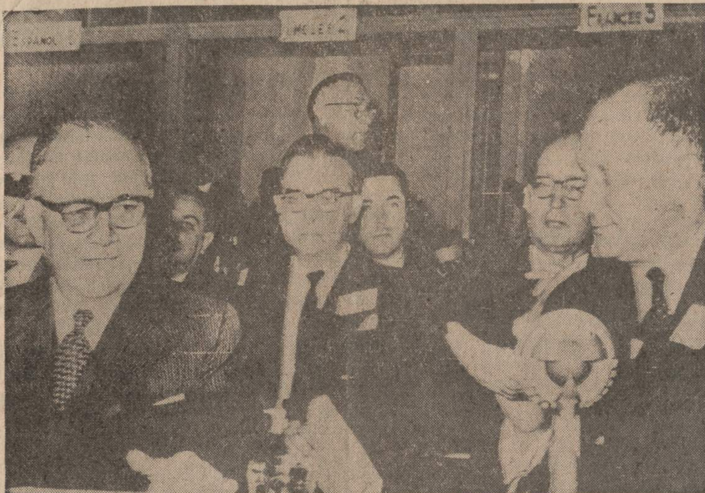
JAV išdo sekretorius Douglas Dillon (dešinėje) ploja Brazilijos finansų ministru Clemente Mariani (kairėje), kai tas baigė kalbėti Ekonominėje ir socialinėje panamerikine konferencijoje, vykstančioje Punta Del Este, Urugvajuje.

Jis yra šeštas atominis nardlaivis, ginkluotas balistinėmis Polaris raketomis, pagerinto tipo, kurias gali laidyti pasinėrus ir kurios nešėtų branduolinę bombą už 1,500 mylių. Kaip ir anksčiau, įvedimo į laivyno tarnybą ceremonijose dalyvavo būrys pacifistų pade monstruoti savo nusistatymą prieš šalies ginklavimąsi.