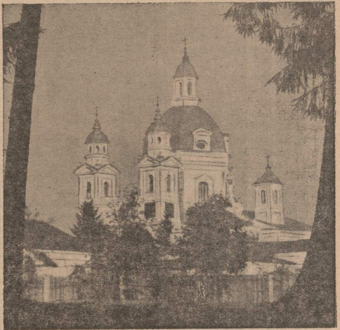
Pažaislio vienuolynas arba vadinamieji „Kamenduliai“