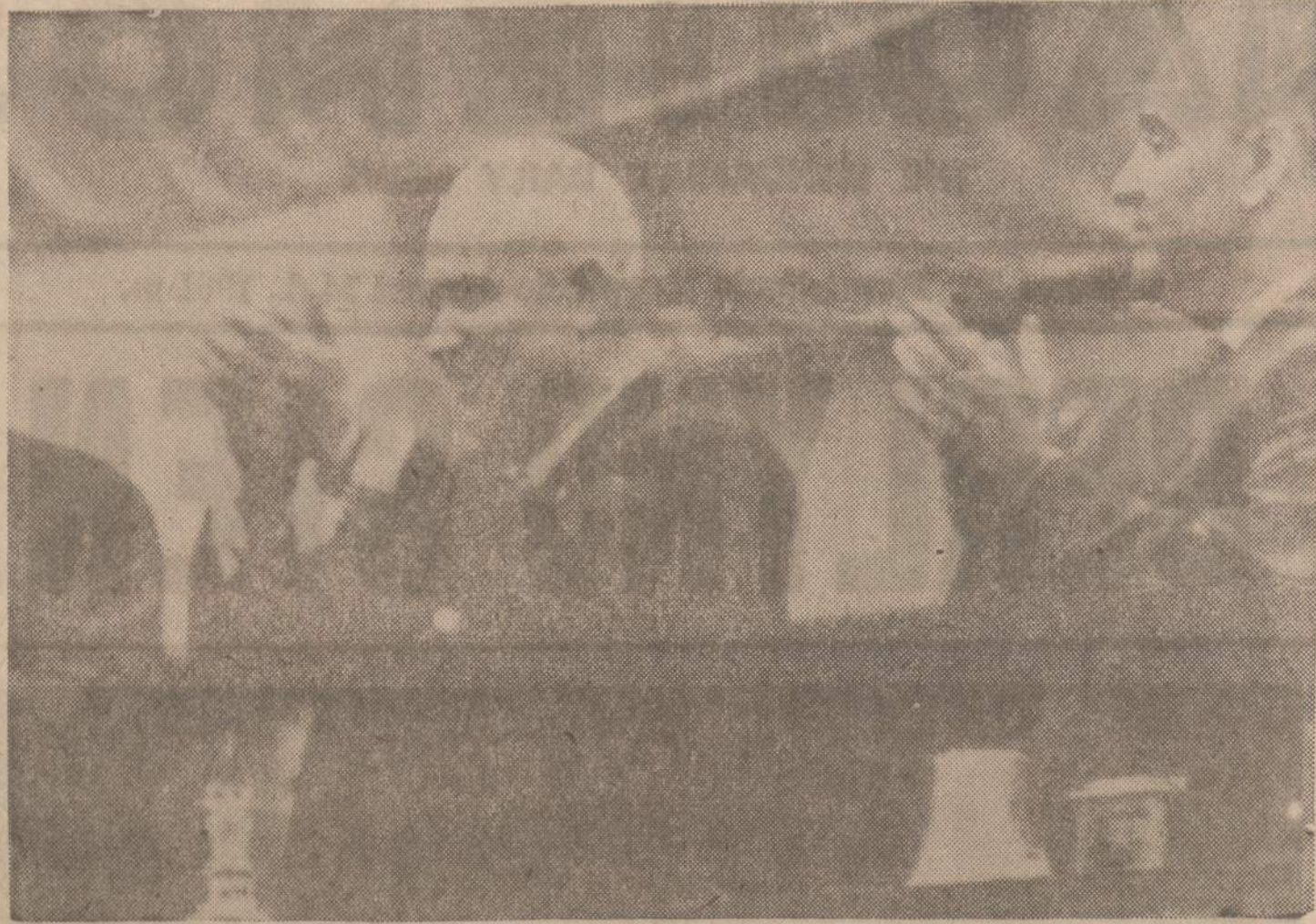
Sovietų premjeras Nikita Chruščiovas patenkintas Ruminijos premjero George Chiorhiu-Dej (dešinėje) plokiumu Kremliaus rūmuose.

Begulint man atėjo nauja mintis. Langą turiu griebti ne priešakin, bet nugarą. Jeigu šitaip atsistokiu man vis dėlto kojomis pavyktų pasiekti lubas, tai tada ir per langą išlipti. Taip ir padariau. Nugarą atsistojau ties langu. Pasišokęs pasigriebiau už krašto, o vėliau, prisitraukęs, bandžiau pasiekti lubas. Kada viena koja užsikabino už lubų, tai toliau lubomis eidamas, aišku, galva žemyn, pasiekiau vie-