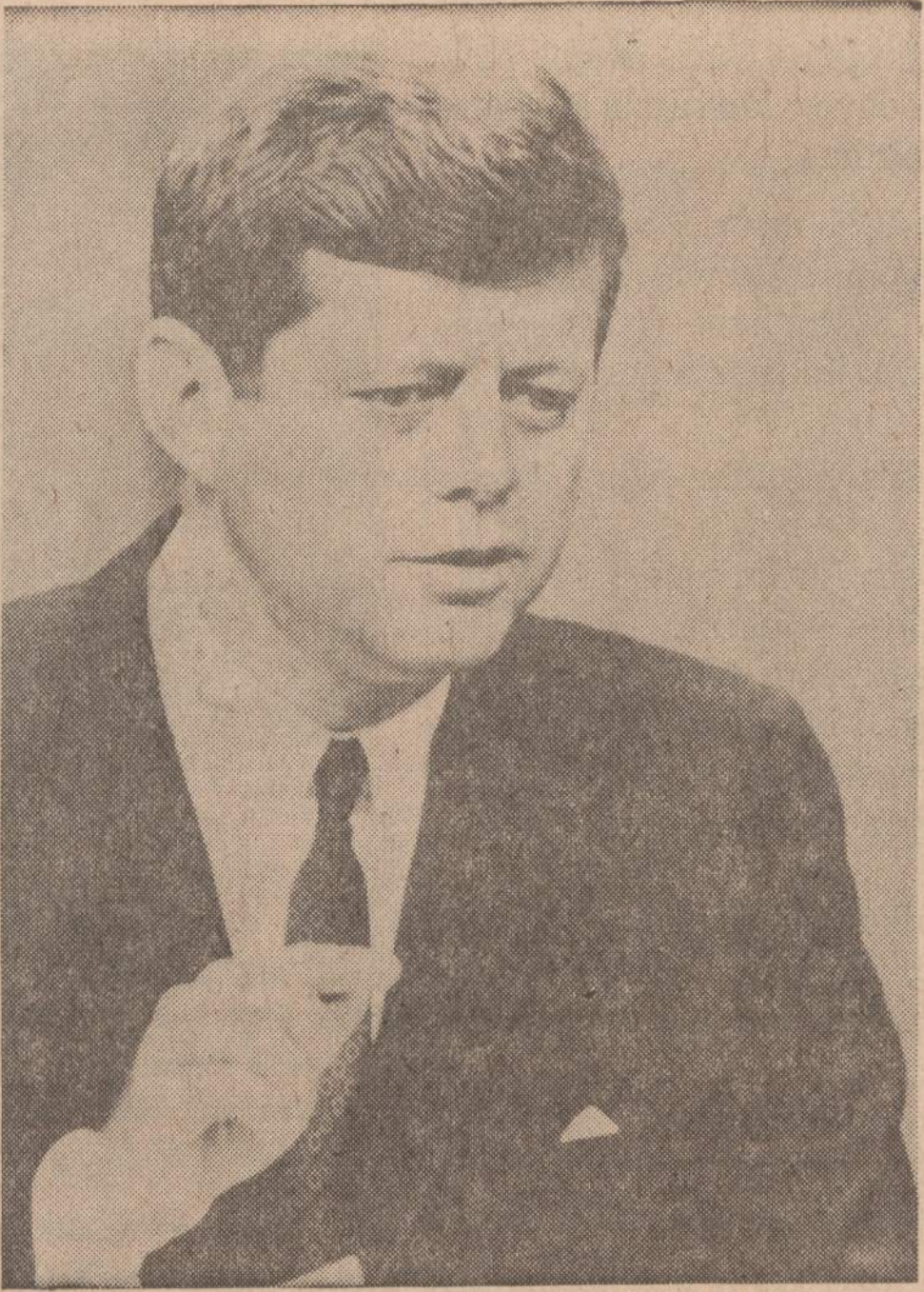
Prezidentas Kennedy spaudos konferencijoje iš naujo pabrėžė, kad turi būti daromos visos pastangos taikingai išspręsti Berlyno krizę.

Sutiko. Rytojaus dieną jau ponui ministru nereikėjo daug aiškinti. Šiuokart jis pasisvei- kino, padavė ranką ir padėjo