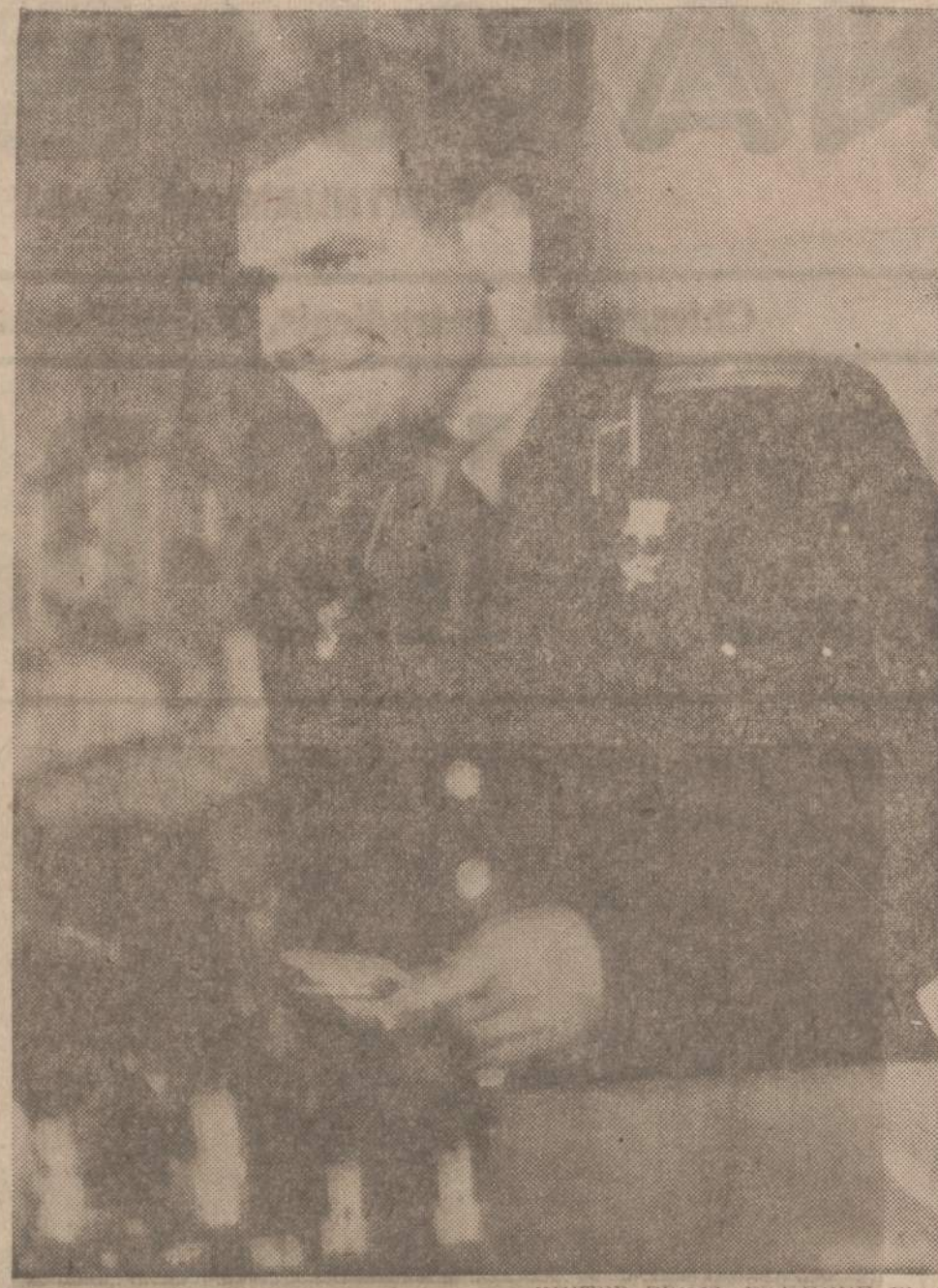
Sovietų kosmonautas Herman S. Titov spaudos konferencijoje Maskvoje. Jis pasakojo, kaip, 25 valandas išbuves erdvėje, jis nusileido atgal į žemę.

Raudonosios policijos šuo Rytinės Vokietijos liaudies policija Tiuringijos pasienyje sugavo tris įtartinus spekulian-