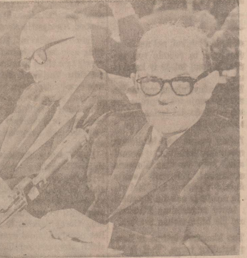
Valstybės sekretorius Dean Rusk pareiškė senato užsienio reikalų komitetui, kad galima tikėtis dar pavojingesnės politinės ir militarinės krizės, kuri sukrs pasauli. Rusk ragino užgirti prezidento Kennedžio planą, kuris numato įsigili nusiginklavimo agentūrą. Kairėje nusiginklavimo patarėjas John J. McCloy.

banėčių taškelių, tartum ugnies kibirkstys. Vienu akies mirksniu pasirodė Haleraui, kad jis sapnuoja. Bet tas reginys buvo ne koks sapnas ir jis už šmėklą paskaityti buvo negalima. Be to, jis girdėjo savo bičiulių šauksmus, buvusį visai netoli, tik neįveikiamos klūties nuo jo atskirtų. Už tos juodosios bangos matė jis piestu stojančius arklius, girdėjo nusigandusio savo šuns lojimą ir arklių žvangimą. Kada nuo jo ligi atžiančios bangos buvo nedaugiau 50 žingsnių, jis pastebėjo gauruotus buivolų karčius, jų liepsnojančius akis. — Viešpatie, jie bėga tiesiai į mano pusę! — sušuko jis persigandęs. — Jie sutremp's mane! Mėginti bėgti buvo per vėlu, bet ir nebūvo kar bėgti. Haleras išstūtkitvial pamatė šautuvą ir sovė į priesakyje bėgantį buivolą. Ar pataikino — to jis nematė. Tik pajuto, kad jo veidas aptaškytas upės vandeniu, pamatė, kad vienas didžiulis buivolas, kiek atsisakyęs nuo bandos, įnirtęs puolė į kalvą, prie kurios jis stovėjo. Viena akymoju — ir jis lėkė jau oru, buivolo ragų išmestas aukštyn. Jis lėkė atgal. Nukrito ant kažkokios judrios masės, pajutęs aštrų sopėjimą šon-