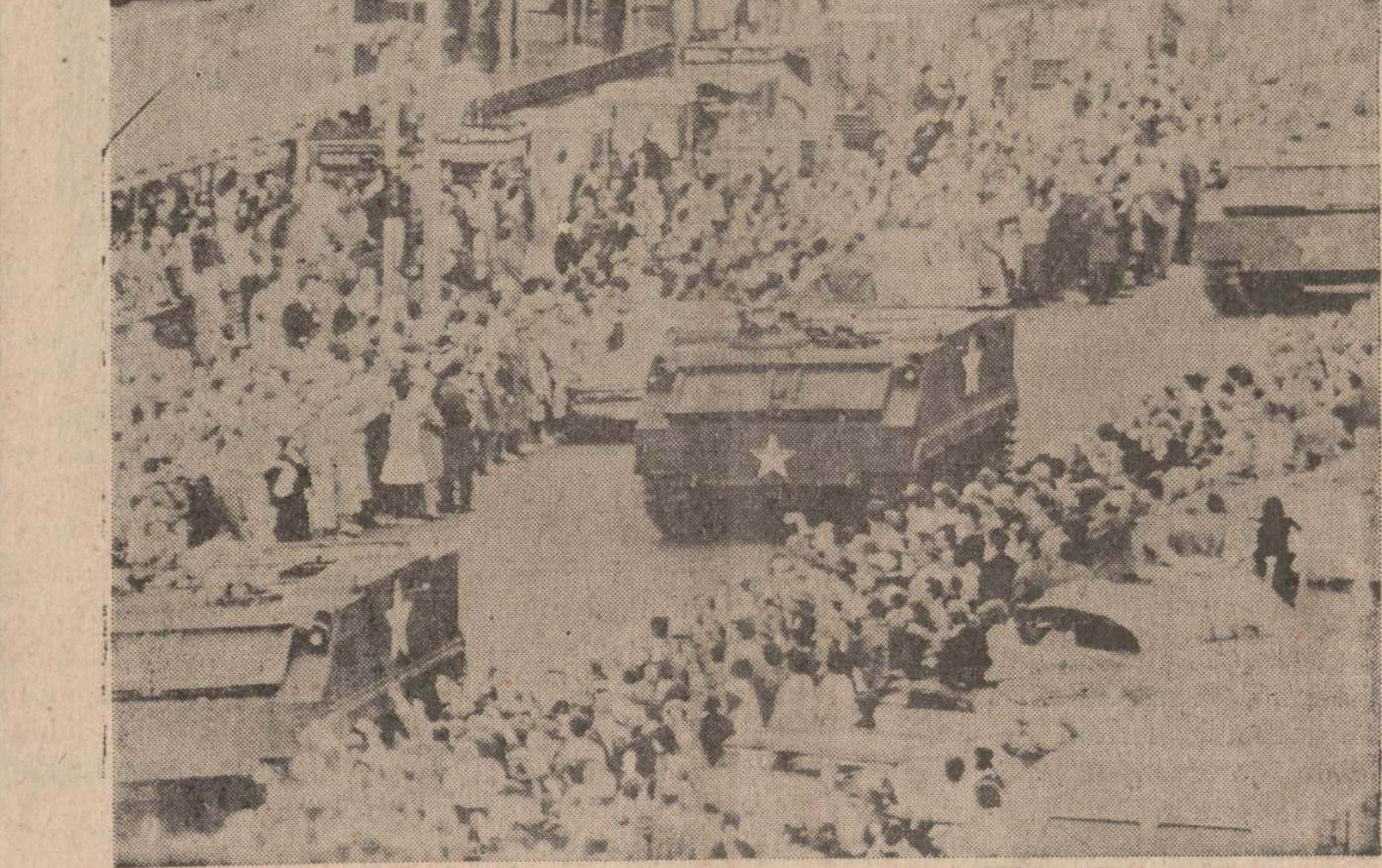
Atvyko Amerikos karo jėgos. — Berlyno gyventojai sveikina Amerikos karo jėgas, sekmdienį atvykusias iš Vakarų Vokietijos.

(E) Vilniaus radijo pranešimu Kauno istoriniame muziejuje (buv. Vytauto Didž. muz.) atidarytas naujas skyrius "Pirmąsytė visuomeninė santvarka T. Lietuvos teritorijoje". Esą, jau užpildyta buvusi spraga ir dabar muziejus vaizduos Lietuvos istoriją nuo seniausių laikų iki šių dienų. Šis skyrius sudarytas panaudojant visos Lietuvos teritorijos radinių, tyrinėjimų medžiagą. Skyriuje atspindi anuo metu gyvenusių žmonių buitį, verslai, visuomeniniai santykiai, ideologija.