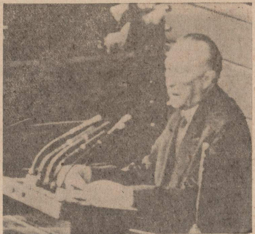
Vakarinis Vokietijos kancleris Konrad Adenauer, kalbėdamas Bundesstage (atstovų rūmose), kvietė taikingu būdu išspręsti Berlyno krizę...