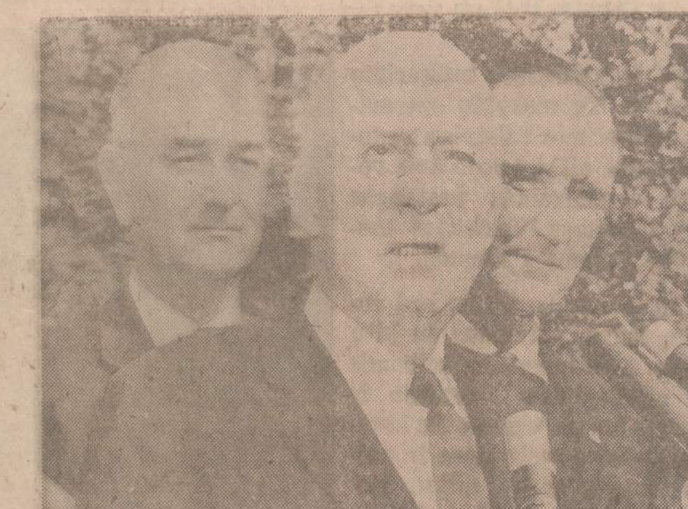
Positarimas pas prezidentą Kennedy. Dalyvausia kongrese pirmininkas (Speaker) Sam Rayburn (centra), viceprezidentas Lyndon Johnson (kairėje) ir senato daugumos vadovas Mike Mansfield.

Tėvelis: — Taip, sūneli, yra. Reikia pamatyti antrą kartą!