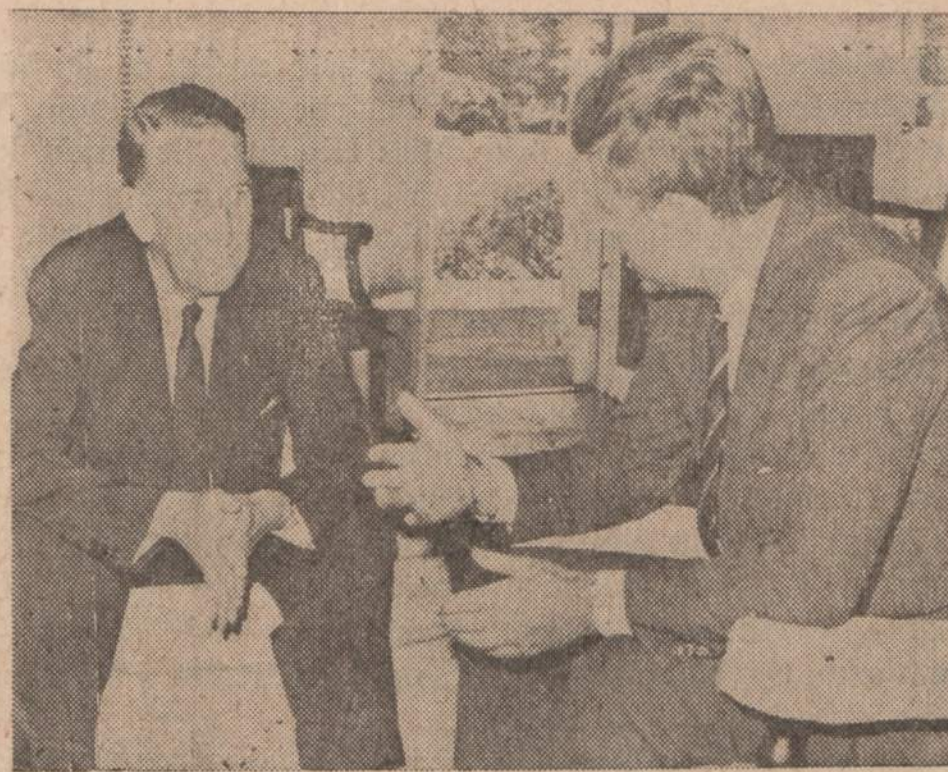
Prezidentas Kennedy tariasi su Llewellyn E. Thompson, Amerikos ambasadorium Maskvoje, apie vėliausius įvykius Berlyne.