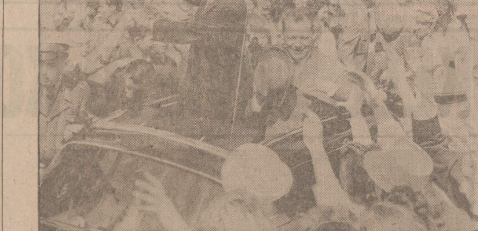
Berlyniečiai sveikina Johnsoną. — Berlyniečiai pažangmingai sveikina JAV viceprezidentą Lyndon B. Johnsoną, praėitį sekmadienį aplankiusį Vakarų Berlyną. Greta Johnsono matome Vakarų Berlyno burmistra Willy Brandt. Viceprezidentas Johnson ir burmistras Brandt pasveikino Amerikos karo jėgų dalinį, iš vakarų Vokietijos atvykusį į Berlyną.