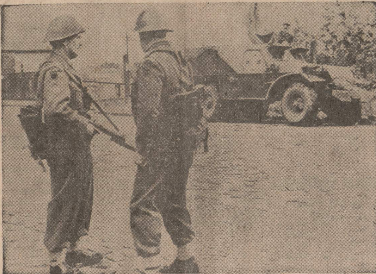
Rytinės Vokietijos raudonarmietis žiūri iš savo šarvuotio į gerai ginkluotus britus, užimančius kovos pozicijas Vakariniame Berlyne priešais komunistų saistomą "geležinę uždangą". Britai atsiuntė sustiprinimus, kadangi kitapus "geležinės uždangos" staiga buvo pasirodė 500 apginkluotų raudonosios policijos vyrų.

Kad suderintų įstatymą su senais poligaminiais papročiais, vyriausybė pasiūlė seimui išleisti naują įstatymą. Parlamento nariai yra poligaminei tvarkai palankūs. Po šalį valdžios pareigūnai apklausinėja žmonių nuomones, ir jie beveik visi reikalauja palikti senąją tvarką. Įstatymo projekte numatyta leisti oficialiai turėti vieną žmoną, o kitos bus vadinamos meilužėmis, tarp kurių ir žmonų, o taip pat tarp legaliai ir nelegaliai gimusių vaikų ganiečiai skirtumo nedaro.