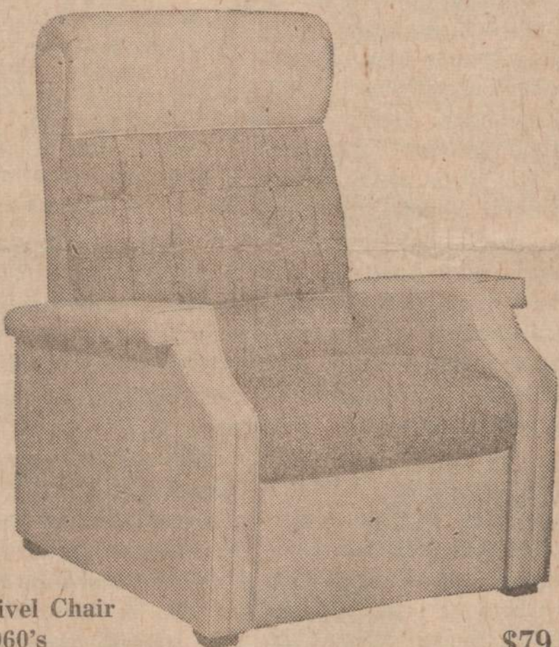
Avon Swivel Chair one of 1960's fastest sellers

Now at SOLTIS SEMI — ANNUAL CHAIR SALE These are just a few of many styles available as pre — season values at prices that you can afford