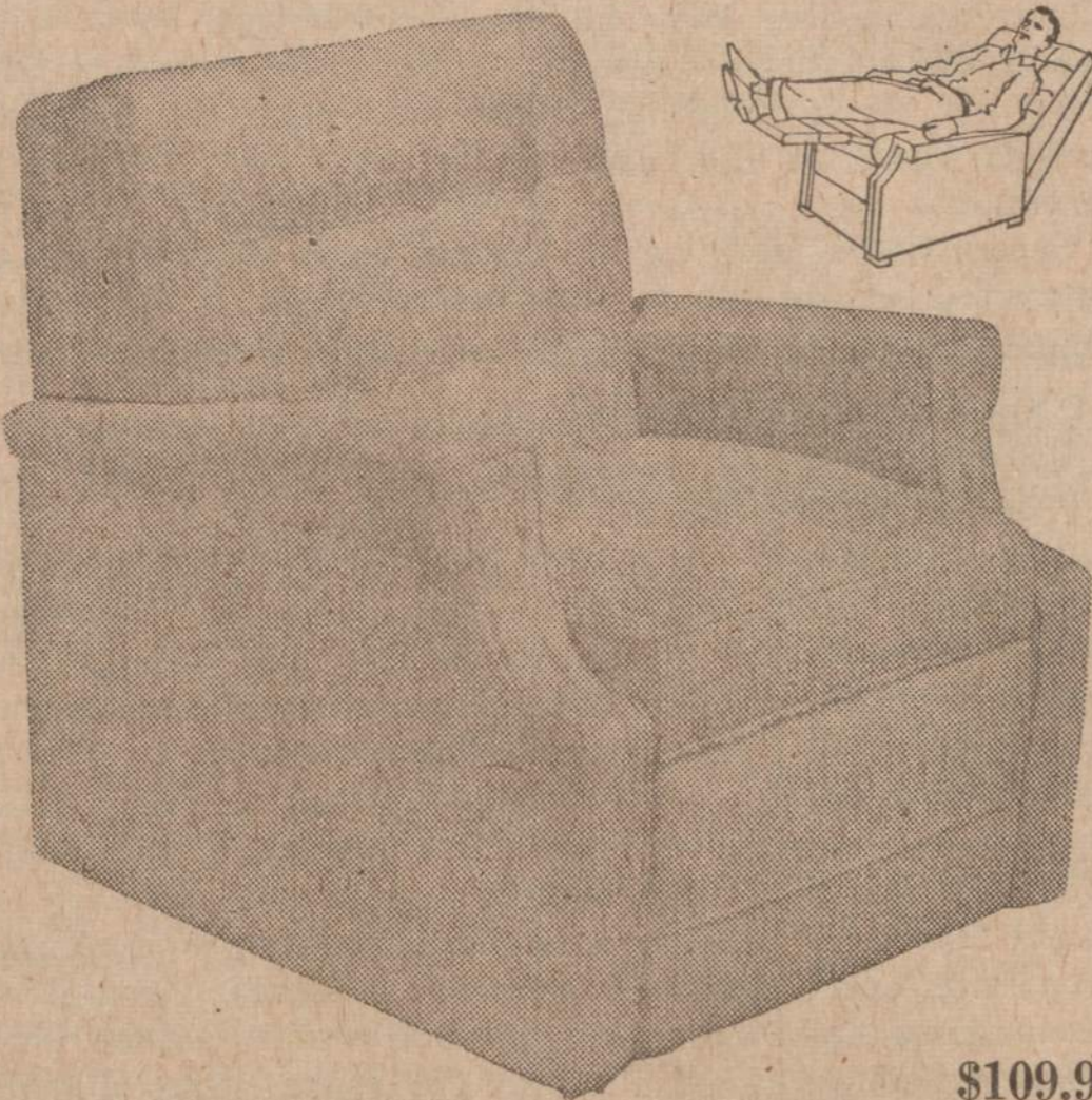
Believe it or not, this beautiful chair with pop-up back reclines, etc. Sold for $149.95 in 1960