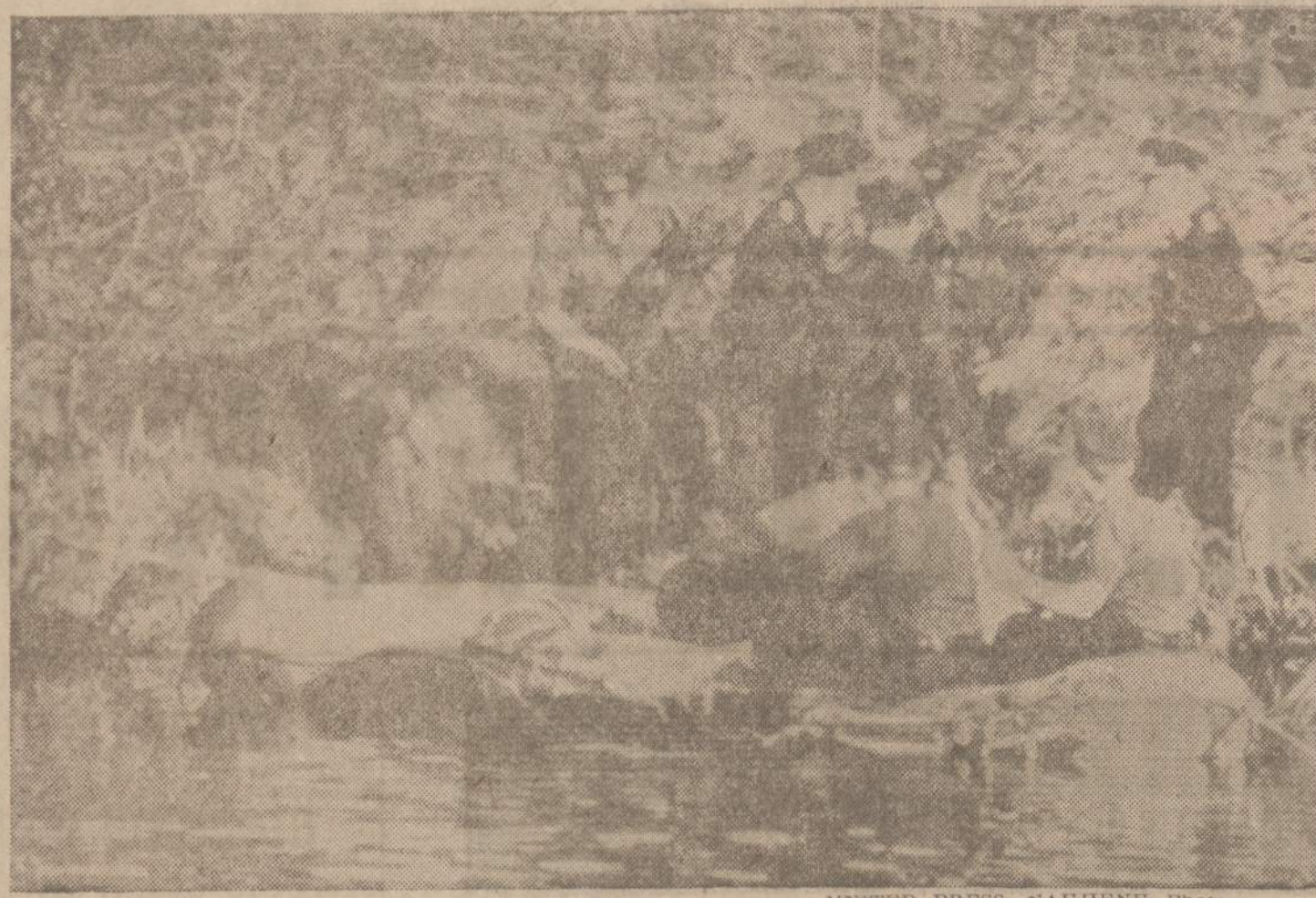
Rytų Berlyno komunistinė policija ir gaisrininkai guminėse valtyse atsisemia nuo kranto, plaukdami į Tetlow kanalą ieškoti ką tik nušauto jauno vyro, kurio bandė perplaukti kanalą ir pabėgti į laisvę.