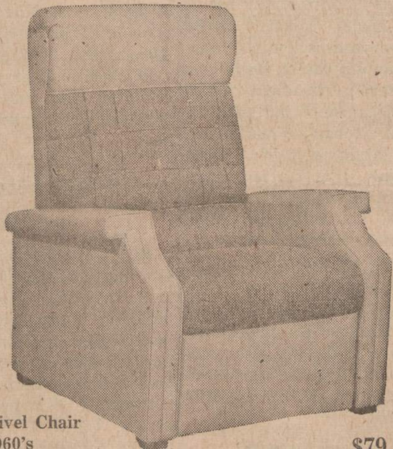
Avon Swivel Chair one of 1960's fastest sellers

These are just a few of many styles available as pre — season values at prices that you can afford