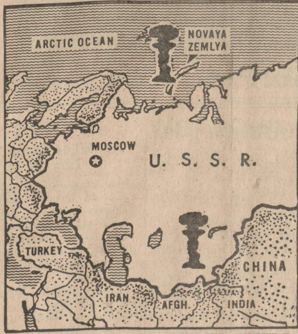
Kur Sovietų Rusija sprogdina savo atominės bombas. Sovietams paskelbus, kad jie pradeda "branduolinių ginklų eksperimentinius bandymus", pasibaigė 34 mėnesius trukęs susilaikymas nuo tokių ginklų sprogdinimų. Šiame žemėlapyje nužymėtos vietos, kur sovietai savo bombas sprogdina: 1) Novaja Zemlia sala Barento jūroje; 2) šiaurinė Arktikos Rato; 3) Pietvakarinis Sibiras, 4) šiaurinė nuo Indijos ir vakarus nuo Kinijos.

Japonijos spauda, be išimties, smerkia sovietus. Net kairiasparniai, kurie pirma buvo gana palankūs Maskvai, ir tie pasisakė prieš branduolinių ginklų bandymus.