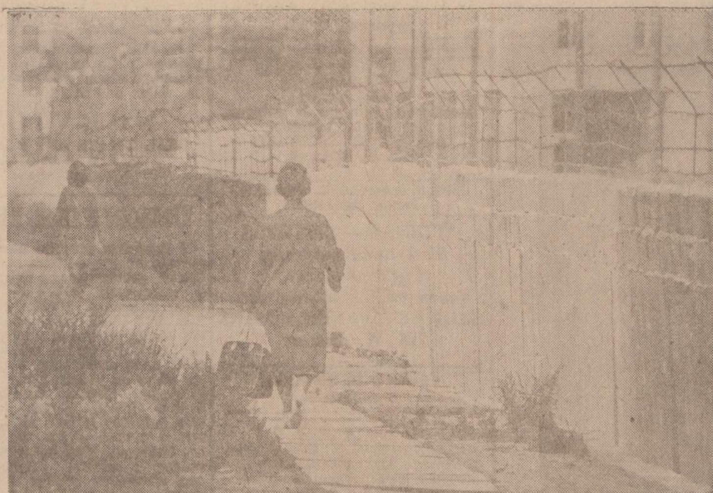
Dvi berlynietės eina išilgai komunistų pastatytos mūro ir spygliuotų vielų sienos, priešais kuria JAV igulos daliniai darė savo pirmus manevrus.

SOPHIE BARCUS RADIJO ŠEIMO VALANDOS Visos programos iš WOP, 1490 kil. AM. 102-7 FM. Lietuvių kalba: kasdien nuo pirmadienio iki penktadienio 10-11 val. ryto. - Šeštadienį ir sekmadienį nuo 8:30 iki 9:30 val. ryto. VAKARUŠKOS: pirmadienį 7 v. v. Anglų kalba: nuo antr. iki penkt. 7-7:30 val. vak. Tel.: HEMlock 4-2413 7159 SO MAPLEWOOD AVE. CHICAGO 29, ILL.