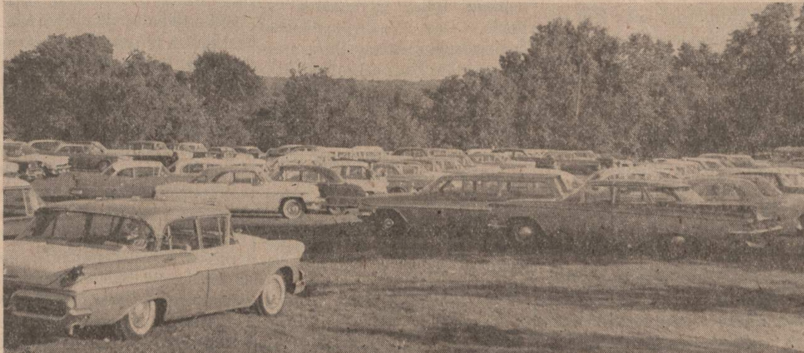
1961 metų rudeninį Naujienų pikniką suvažiavo labai daug automobilių

Ateityje būsiu atsargesnis. Mat, vis gyveniu ir mokini. O dėl man duotos pamokos apie draugijos uždarymą, netrukus padėkosiu.