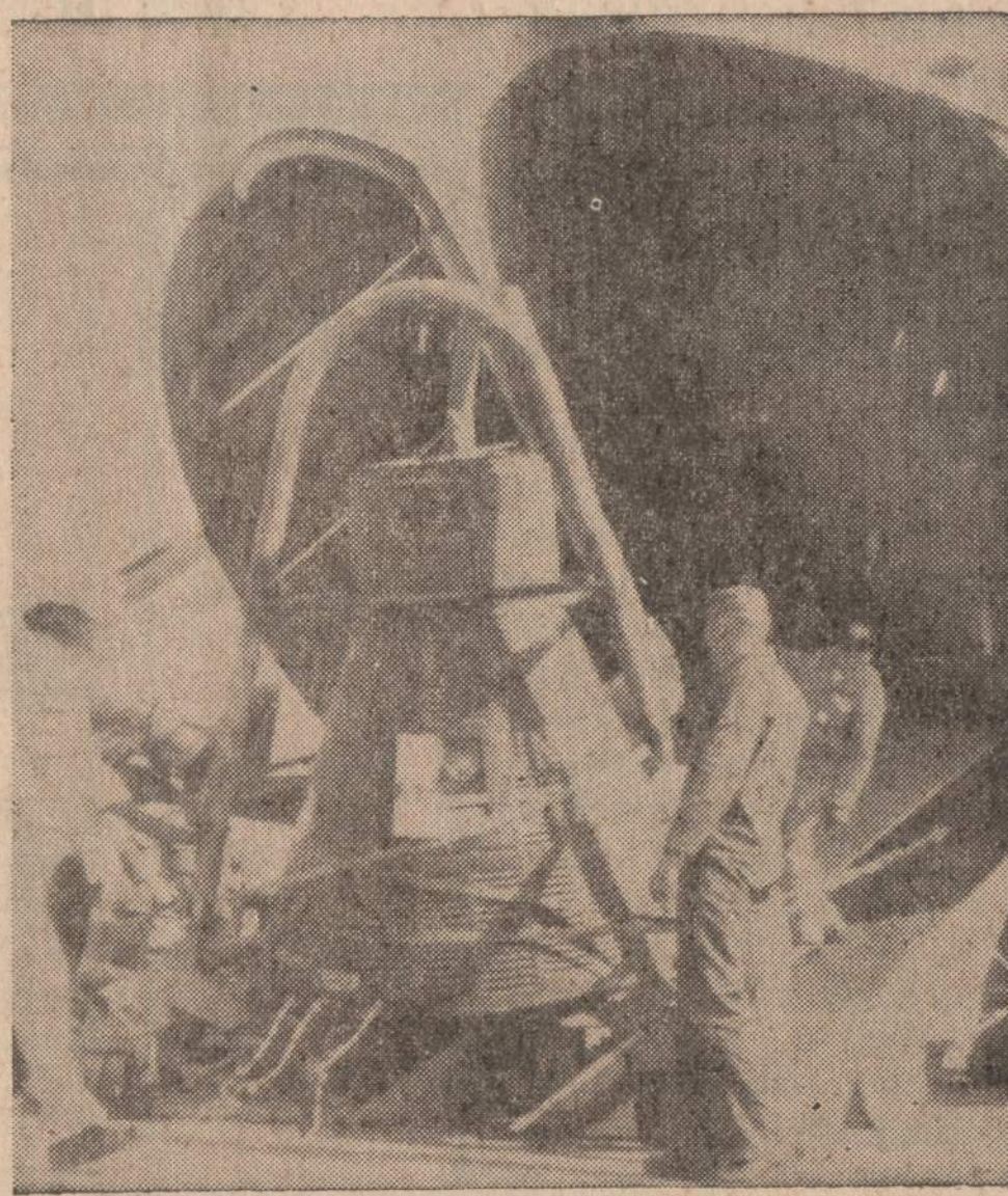
Mercury kapsulė, kuri buvo su robotu astronautu paleista į erdvę, yra įkeliama į lėktuvą Bermudos bazėje. Kapsulė buvo paleista iš Cape Canaveral. Ji nusileido apie 160 mylių nuo Bermudos. Manoma, kad apie šiu metų galą Amerika jau galės paleisti į erdvę ir žmogų (atsėit, astronautą), kuris apskris aplink žemę vieną ar daugiau kartų.

Per pastaruosius trejus metus atominės šalys (JAV, SSSR ir Anglija) bandymų nebedarė ir vedė derybas Ženevoje dėl sutarties visiškai uždrausti branduolinių ginklų sprogdinimus.