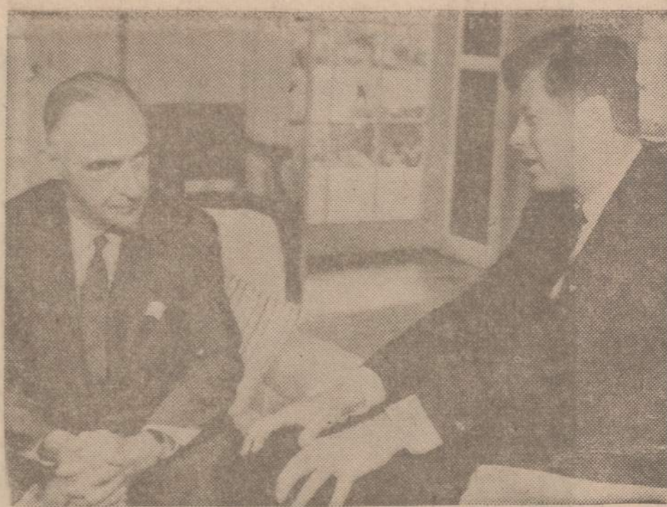
Gen. Lucius Clay aplankė Baltuosius Rūmus prieš iškrisdamas į vakarų Berlyną. Iš prezidento Kennedžio jis gavo instrukcijas, ką turė sčaryti Berlyne.

Stalinas rytinį Berlyno sektorių atsiplėšė nuo trijų vakarinių sektorių ir įsteigė jame komunistų administraciją, kuri rytinį sektorių taip nualino, kad žmonės bėgo iš jo tukstanciais. Jų bėgimui sustabdyti komunistai pastatė mūro ir spygliuotų vielų sieną. Argi Chruščiovas dabar sutiks šitą sieną nugriauti ir vėl pastatyti rytinį Berlyną po bendra miesto administracija?