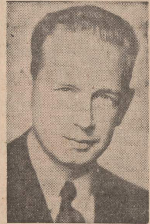
Dr. Dag Hammarskjöld

Hammarskjoldas yra antras švedų diplomatas, žuvęs kovoje už taiką po Jungtinių Tautų vėliava. Pirmasis buvo grafas Folke Bernadotte, karaliaus brolio sūnus. Jį nužudė 1948 m. rugsėjo 17 dieną žydu laisvės kovotojai Palestinoj, kad jis atvažiuo, kaip JT įgaliotinis pašalinti karą tarp žydu ir arabų.