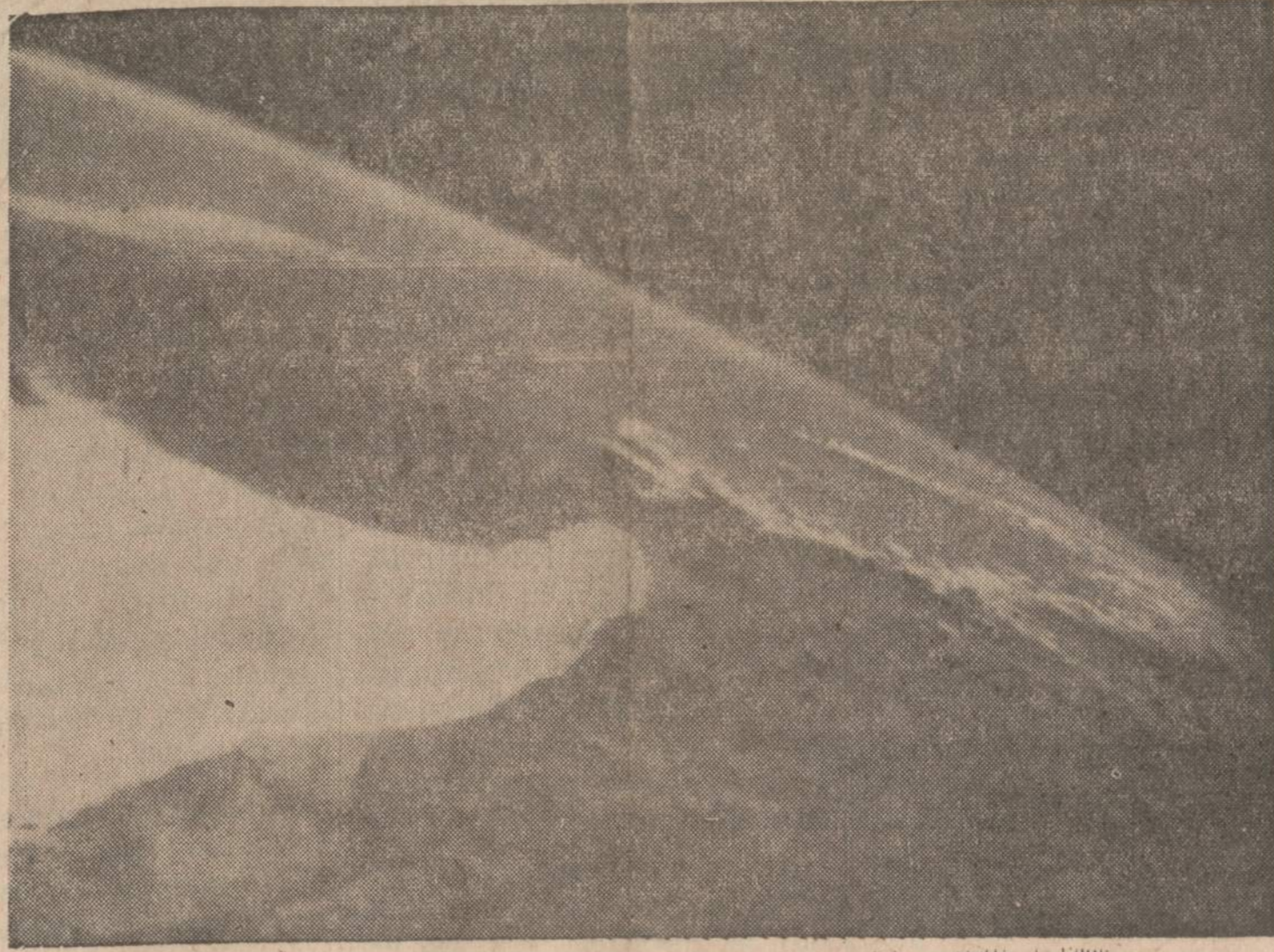
Iš Cape Canaveral (Fla.) rugsėjo 13 d. paleistas į orbitą satelitas nufotografavo vakarų Afriką pakraštį, kuris štai kaip atrodo.

— Bolivijos viceprezidentas Juan Lechin, įveltas į kokaino kontrabandos skandalą, pasitraukė iš pareigų. Skandalą tiria parlamento komisija.