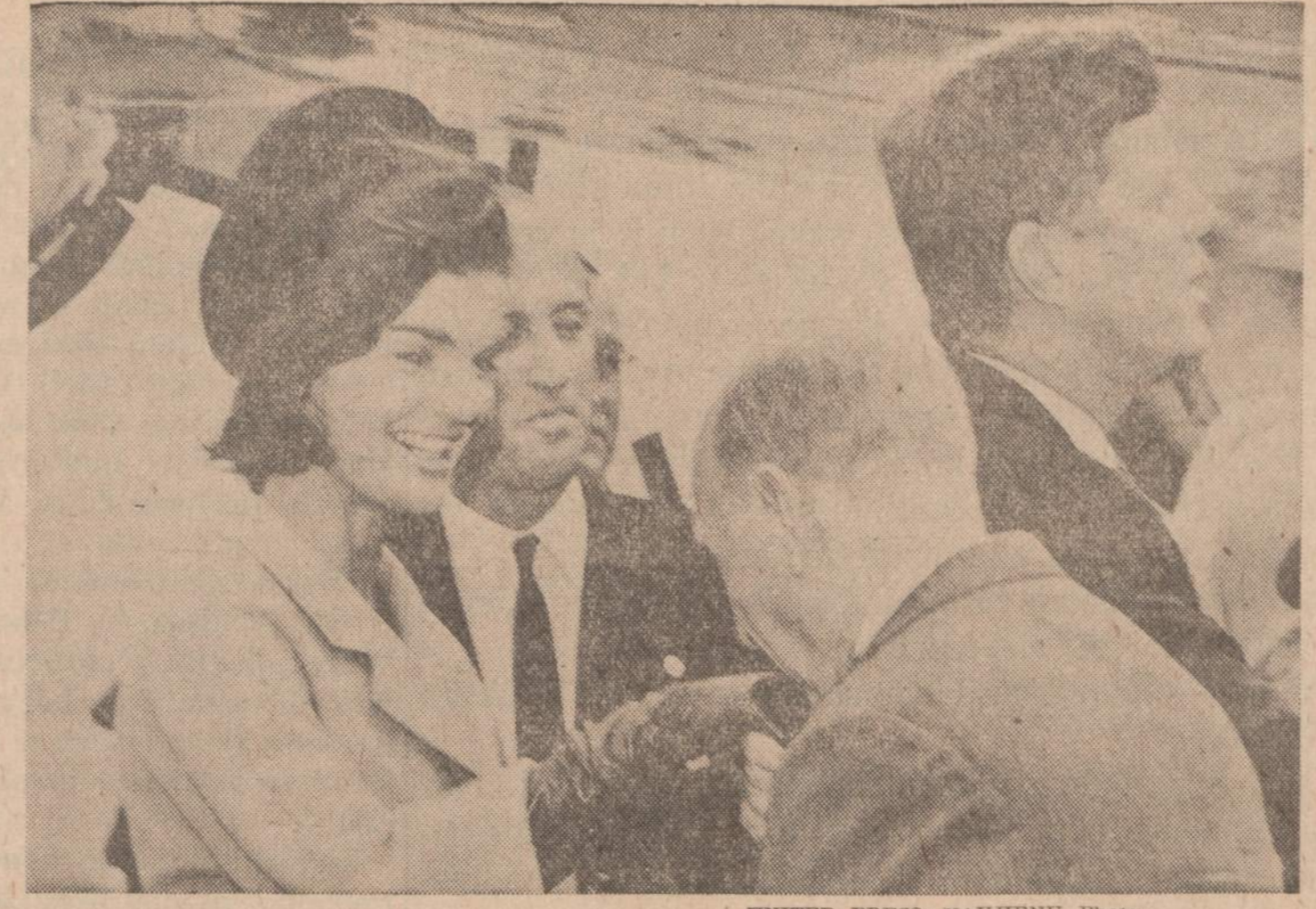
Peru respublikos prezidentas Manuel Prado bučiuoja pirmąją prezidentienės Jaqueline Kennedy ranką Washingtono aerodrome, kur svečių pasitikti atvyko prezidentas Kennedy (dešinėje) su žmona.