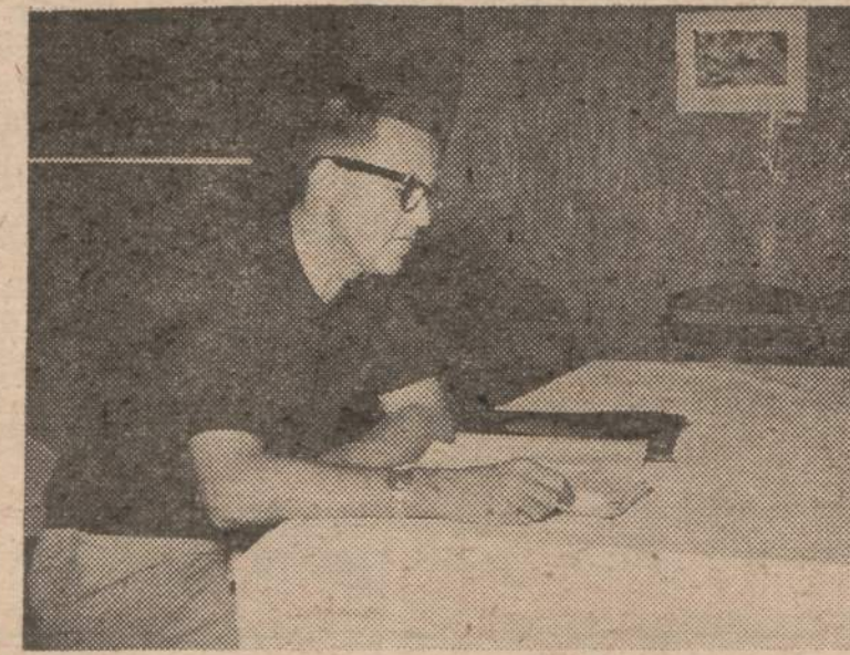
A. Škėmos paskutinis pasirodymas "Santaros" literatūros vakare, Sodus, Mich.

Demand me nothing: what you know, you know: From this time forth I never will speak word W. Shakespeare, "Othello".