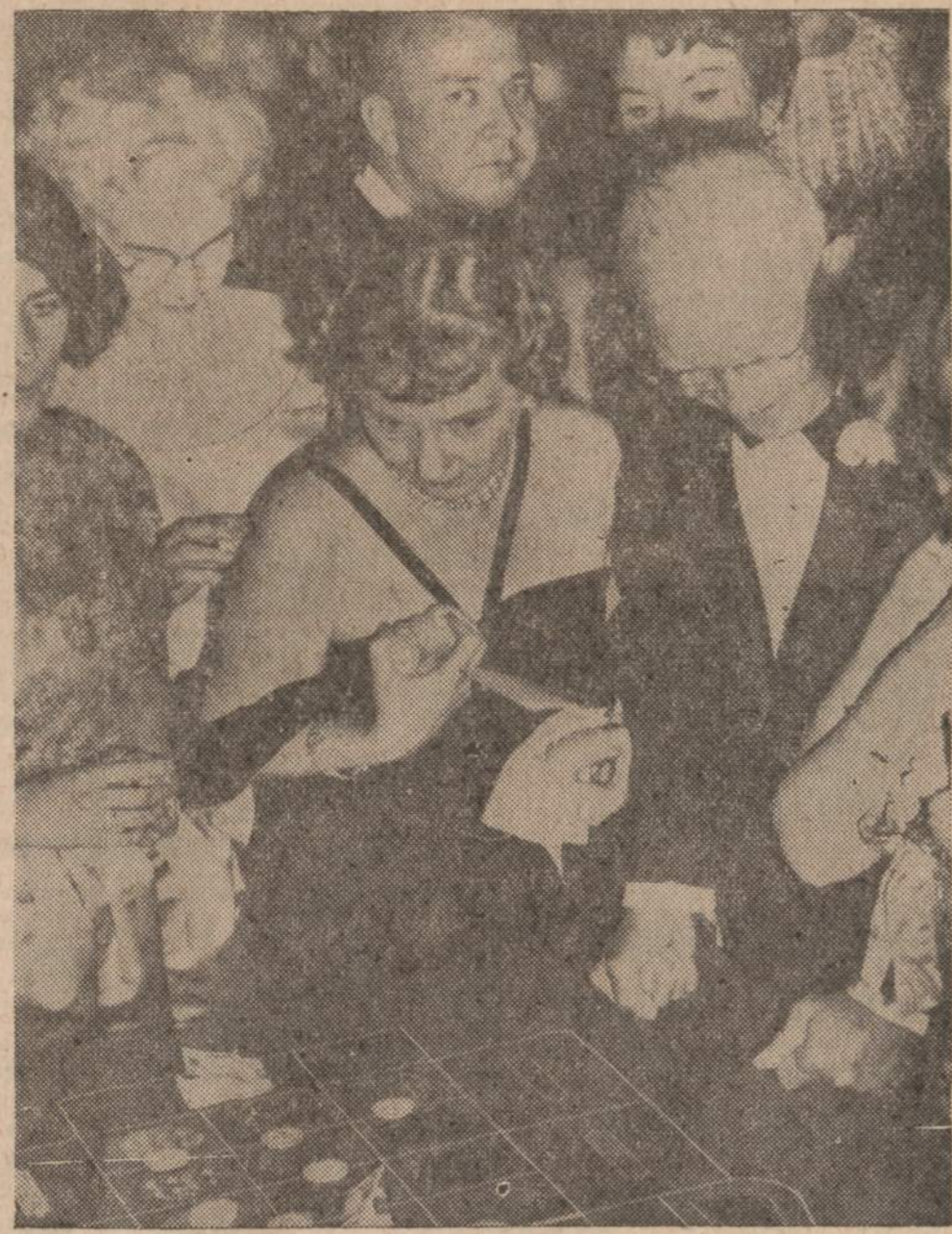
Buvęs prezidentas Eisenhoweris ir jo žmona dalyvavo labdaros gemblinimo pobūvyje, kuris buvo surengtas olandų Nieuw Amsterdam laive prie New York. Po gemblinimo buvo surengtas banketas, kurio dalyviai (jų buvo apie 500) užsimokėjo po $100. Spėjama, kad pelno liks apie $80,000.

SIUNTINIAI Į LIETUVĄ Dabar pagreitintas siuntimas tiesiai iš Chicago į Lietuvą! Siuntiniai pasiekia gavėją už 4-6 savaitių. Sudarydami siuntinį pasitarkite su mumis, ką ir kaip siųsti. Dažnai žmonės siūnia ne tai, kas ten reikalinga. Paskambinkite mums, ir mes paimsime Jūsų siuntinį. LIETUVIŲ KOMPANIJA WORLD PARCEL SERVICE 3320 SO. HALSTED ST. CHICAGO 8, ILL. YA 7-0677