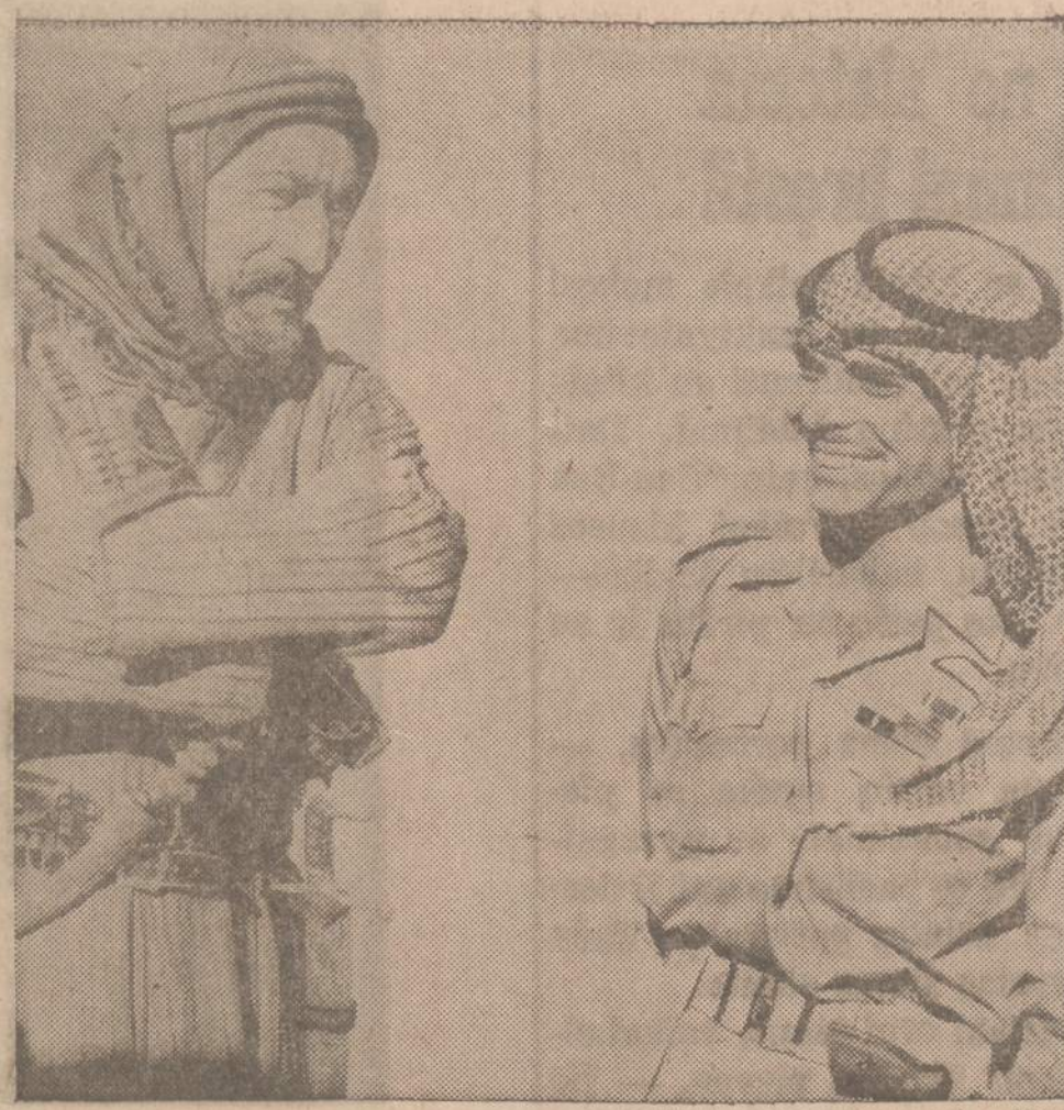
Filmu aktorius Anthony Quinn, kurs naujai sukamame filme "Lawrence of Arabia" vaidina Auda Abu Tayeh rolę. Su juo kalbasi jaunasis Jordanijos karalius Husseinas.

pat padarė didelę pažangą po Ci- vilinio Karo. Tai įgalino pro- dukcijos vientisumą. Jau 1890 m. mašinų įrankiai buvo daromi automatiškai arba pusiau auto- matiškai.