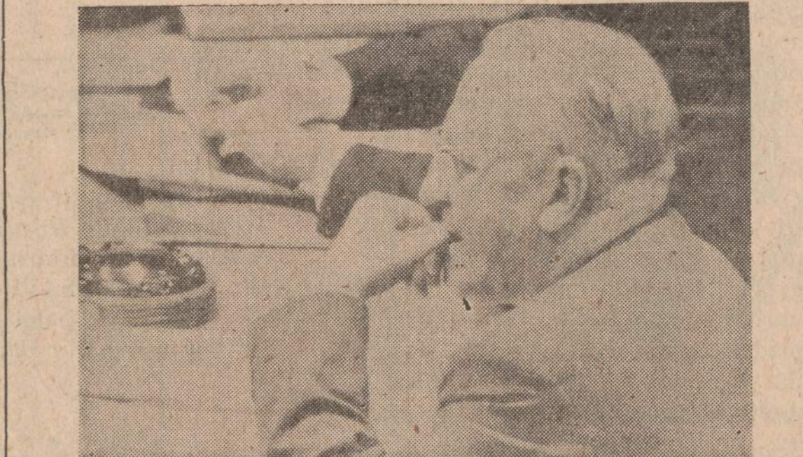
Sovietų ambasadorius Valerian Zorin kramto pirštu nagus Jungtinių Tautų vadovavimo komiteto posėdyje, kai Naujosios Zelandijos atstovas Sir Leslie Munroe reiškia abejonų dėl sovietų teisės laikyti savo kariuomenę Vengrijoje. Komitetas nutarė įtraukti į dienotvarkę Kinijos atstovavimo klausimą.

N. Y. Times korespondentas Sulzberger rašo, ką Chruščėvas kalbėjo vienam užsienio diplomatu praėjus mėn.: "Jei Vakarų Vokietija praras pasitikėjimą Vakarais, ji atsigręž į mus. Kito kelio jai nėra".