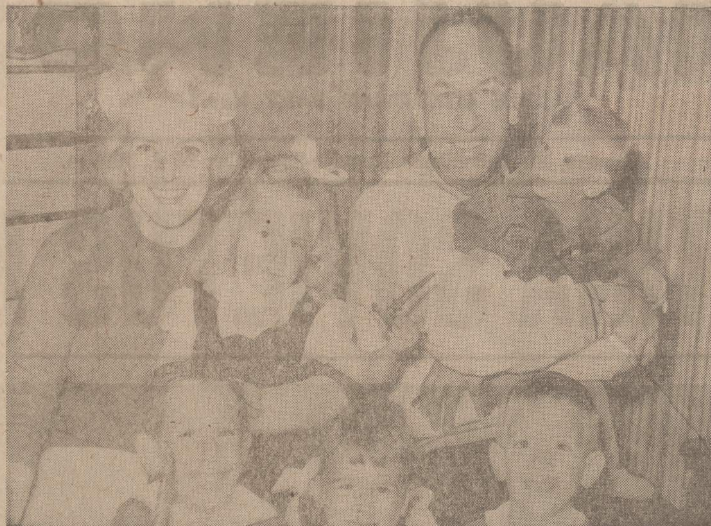
Dainininkės Rosemary Clooney advokatai patvirtino, kad ji nori gauti skyrybas nuo savo vyro, aktorius Jose Ferrer. Šioje nuotraukoje, kuri buvo nuimta priek kiek laiko, matosi Rosemary Clooney, jos vyras Ferrer ir jų vaikai.