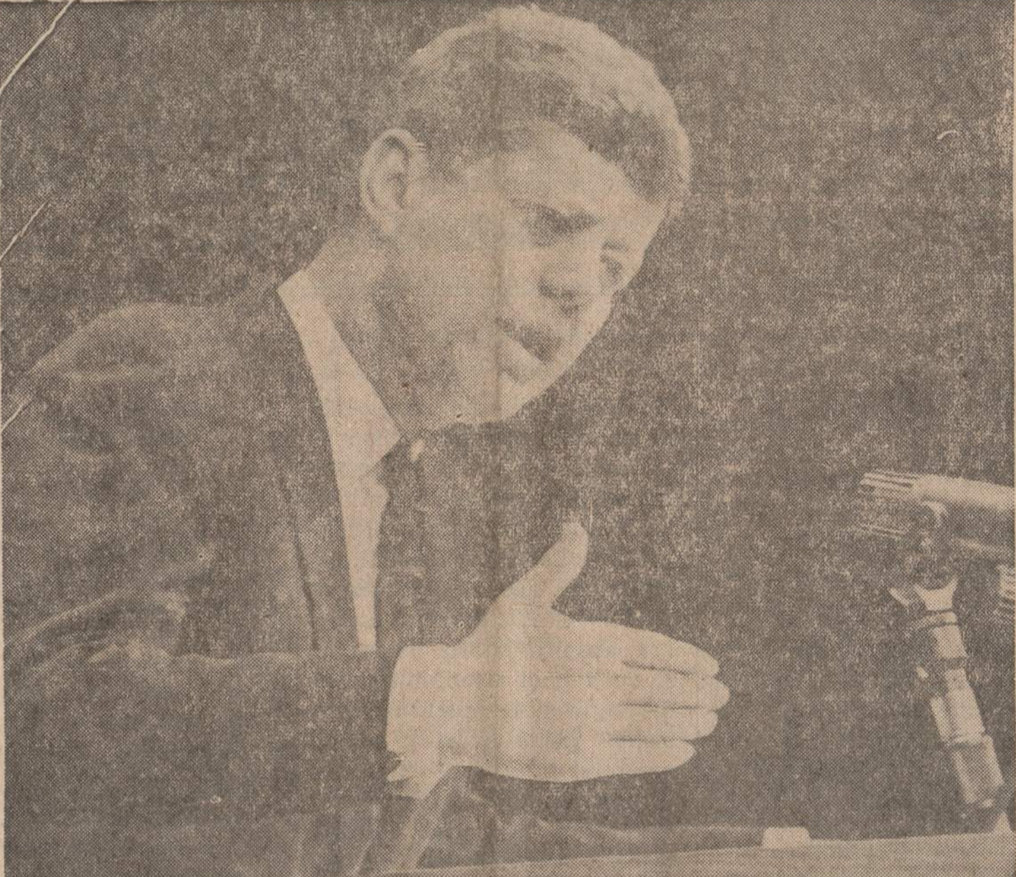
Prez. Kennedy pasakė Jungtinėse Tautose: "Diskutuokime kolonializmą pilnai, iš esmės. Pritarkime laisvo apsisprendimo dėsni visoms pasaulio dalims".

čiuožė visą aerodromo taką ir paskendo iki papildvės uosto dumbline vandeny. Subėgę sportininkų, pramogautojų laiveliai nukėlė visus keleivius į krantą. Tik vienas iš jų lengvai susižeidė.