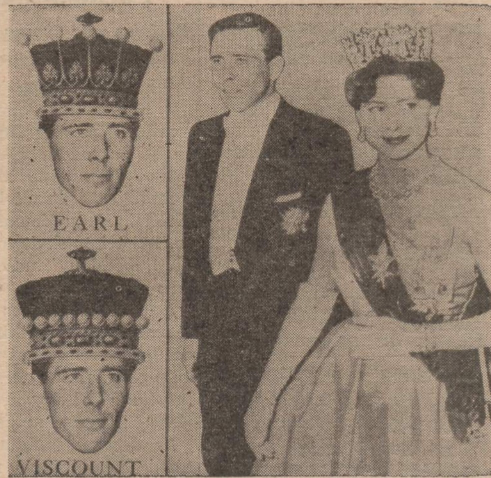
Anglijos Karalienė Elzbieta suteikė princėsės Margaritos vyrui Anthony Armstrong-Jones, "Viscount Linley ir Earl of Snowden" titula. Armstrong-Jones ir jo žmona atrodys kaip čia pavaizduota, kai dėvės minėto titulo reikalaujamą uniformą.

8 — NAUJIENOS, CHICAGO 8, ILL. — SATURDAY, OCTOBER 7, 1961