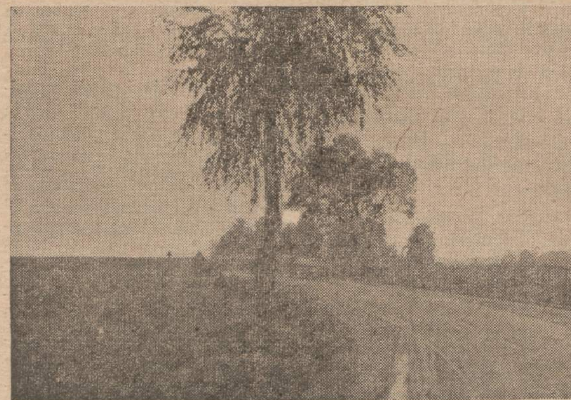
Berzas tėviškės pakelėje