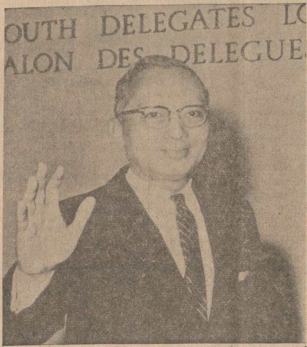
U Thant, iš Burmos, buvo išrinktas Jungtinių Tautų generaliniu sekretoriumi į vietą žuvusio Dag Hammarskjöldo.

Šią savaitę į Gana turi at- važiuoti Anglijos karalienė. Ga- na pasiliko Britų tautų bendruo- menė, bet jos neutralumas ro-