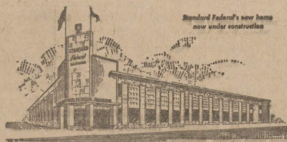
Baigiamas naujas Standard Federal namas