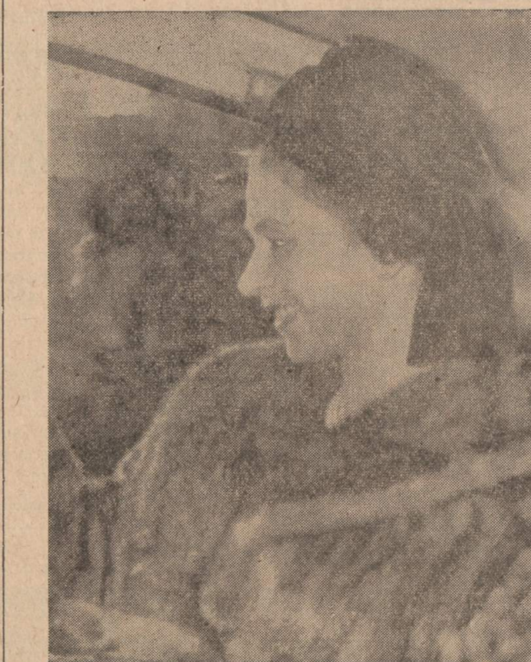
Anglijos karalienė Elizabeth II apleidžia Buckingham rūmus ir vyksta į aerodromą. Ji išskrido į Gana, buvusią Anglijos koloniją, kuri dabar yra nepriklausoma valstybė.

Kitos Lotynų Amerikos repub- likos, nutraukusios anksčiau diplomatinis santykius su Cas- tro Kuba yra šios: Honduras, Salvadoras, Peru, Nikaragva, Gvatemala, Haiti ir Dominika. JAV yra taipgi nutraukusios diplomatinis santykius ir pa- skelbusios prekybos (eksporto - importo) embargą.