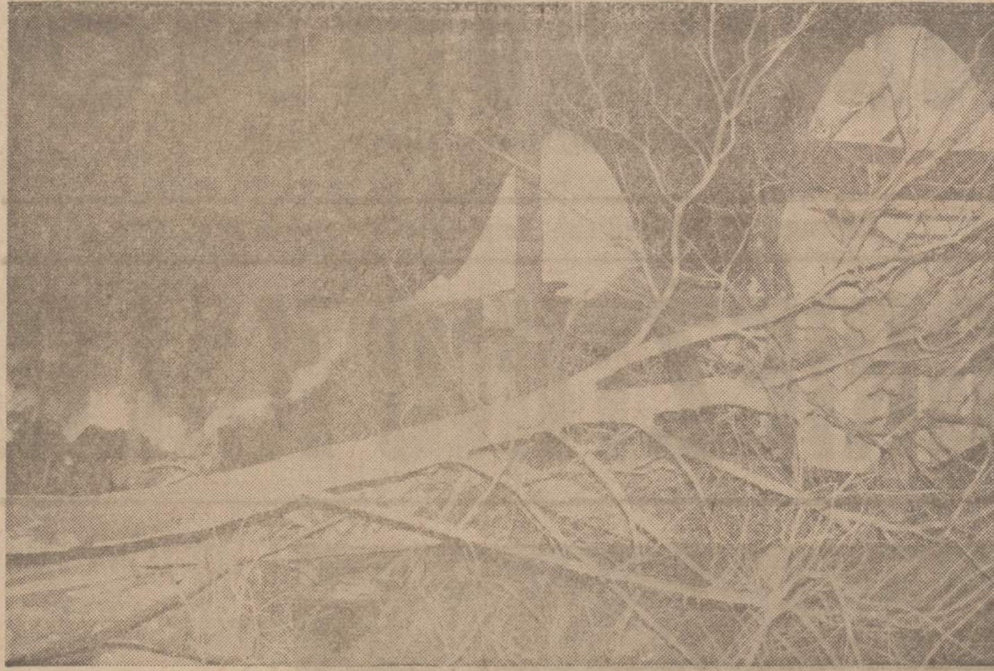
Gaisrininkas (prie medžio, viduryje) apžiūrinėja Constellation lėktuvo laują. Lėktuvas, kuriuo skrido 74 armijos rekrutai į Columbia (S. D.), nukrito netoli Richmond, Va. Gyvi išliko tik du igulos nariai. Nelaimė įvyko dėl motory sugedimo.