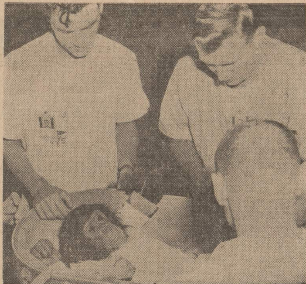
Šimpanzė paruošiama skridimui į erdvę. Netrukus ji bus paleista į erdvę iš Cape Canaveral, Fla.

Prie mūsų Lietuvos paviljono pasigirdo pasipiktinimo balsų, kad latviai, kurie savo paviljoną pasistatė beveik priešais mūsų, turi pasikabine žemėlapi, kuriame Palangą yra įtraukę į Latvijos teritoriją. Nuėjus pasitikrinti, tikrai