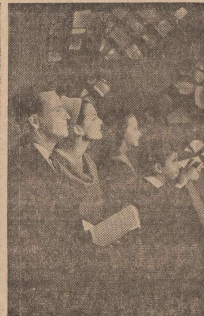
Už geresnę ateitį...