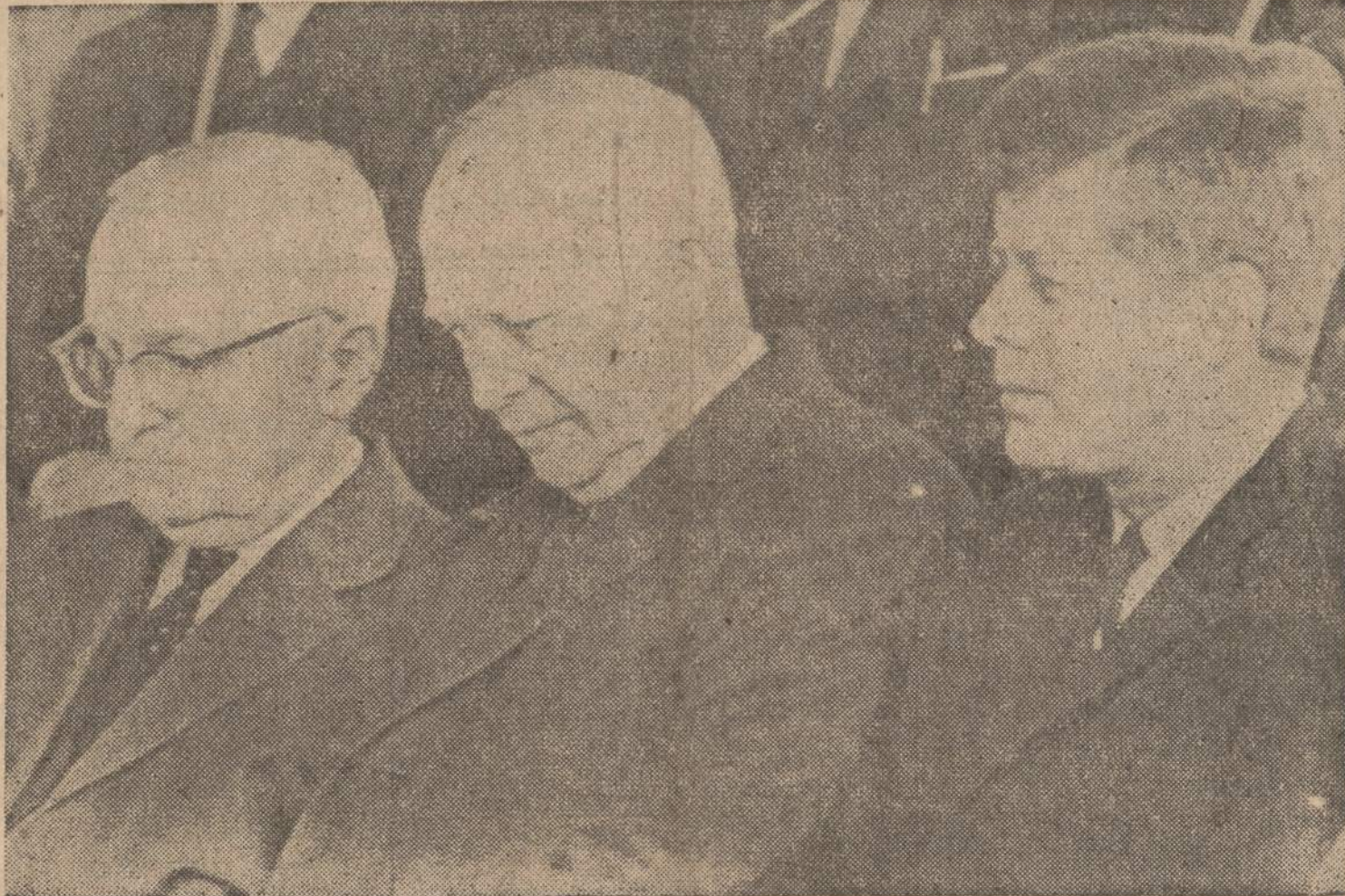
Buvę prezidentai Harry S. Trumanas (kairėje) ir Dwight D. Eisenhower (viduryje) bei prezidentas John F. Kennedy kongreso pirmininko Sam Rayburn laidotuviuose Bonhame, Texas.

Nehru pakartojto patarimą Amerikai ir Rusijai sustabdyti atominius bandymus ir aplamai atsakyti šių ginklų naudojimo. Priešingu atveju viena kitą išsprogdintų į orą.