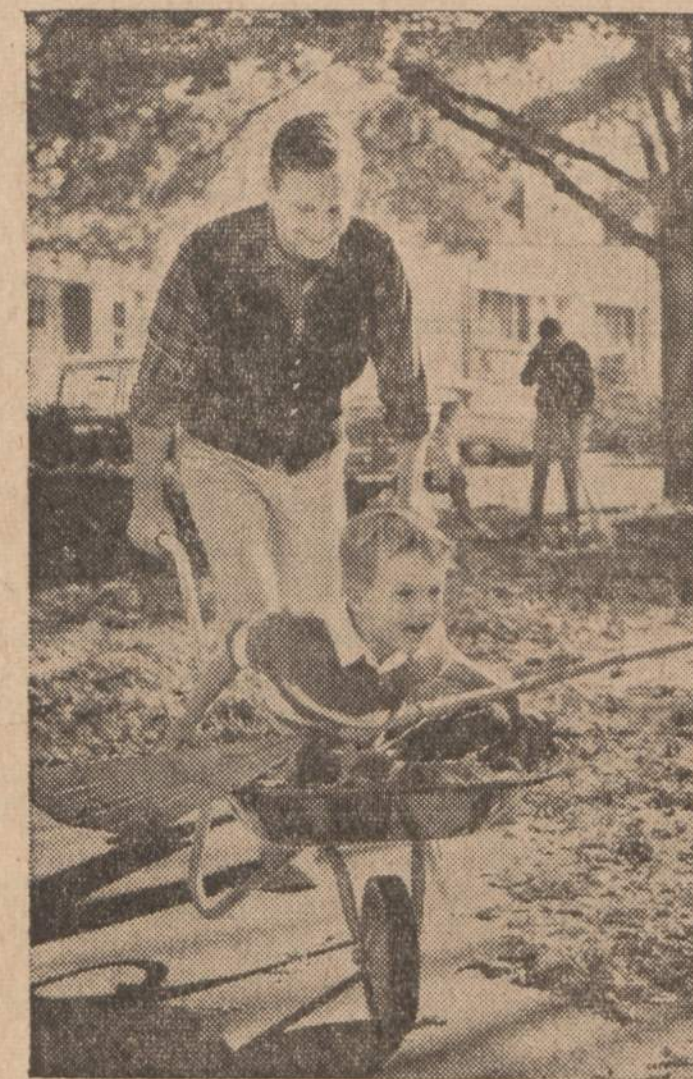
Už mūsų namus...