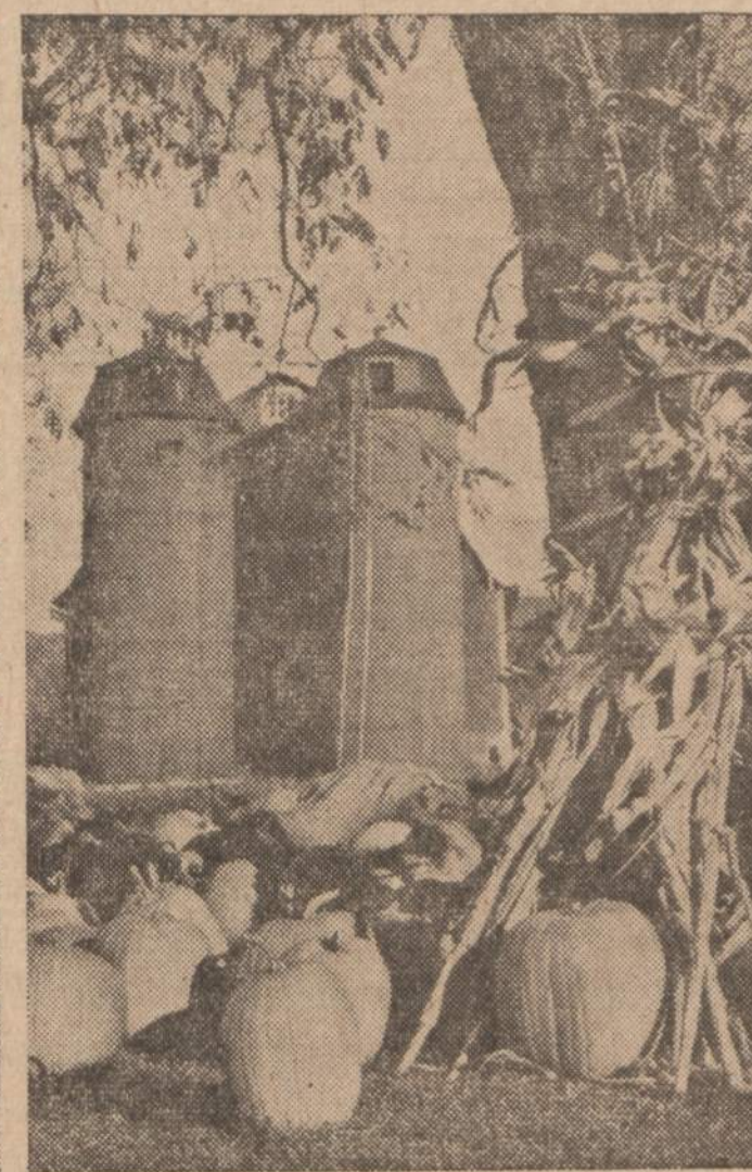
Už gėrybių gausumą...