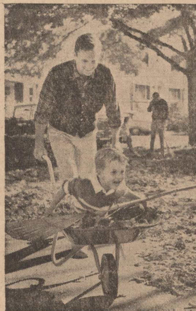
Už mūsų namus...

SEAGRAM-DISTILLERS COMPANY, NEW YORK CITY. BLENDED WHISKEY. 86 PROOF. 65% GRAIN NEUTRAL SPIRITS