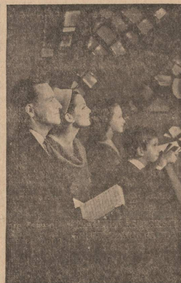
Už geresnę ateitį...