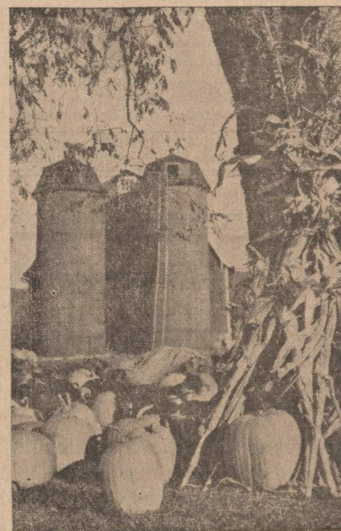
Už gėrybių gausumą...