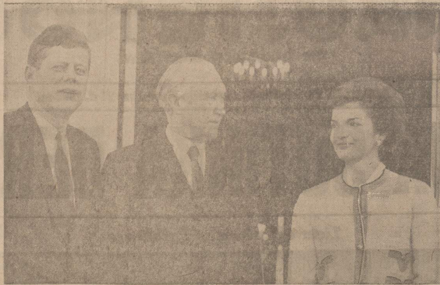
Prezidentas Kennedy, jo žmona Jacqueline ir Vakarų Vokietijos kancleris Konrad Adenauer Baltuosiuose rūmuose.

— Ne, Jūs mane blogai supratote, o gal aš blogai pasakiau. Norėjau pasakyti, kad Londono šerifus pradėjo anksčiau rinkti, negu merus. Savo laiku šerifas buvo svarbiausias Londono žmogus. Jį skirdavo ne karalius, ne valdžia, ne koks ministeris, bet Londono gyventojų atstovai. Merus mes patys pradėjome skirti tikrai prieš kokius 400 metų, tuo tarpu Londono šerifai buvo renkami jau prieš 1,200 metų. Turime užsilikusių senų dokumentų, kuriuose kalbama apie rinktus Londono šerifus jau aštunto amžiaus viduryje. Galėjo juos