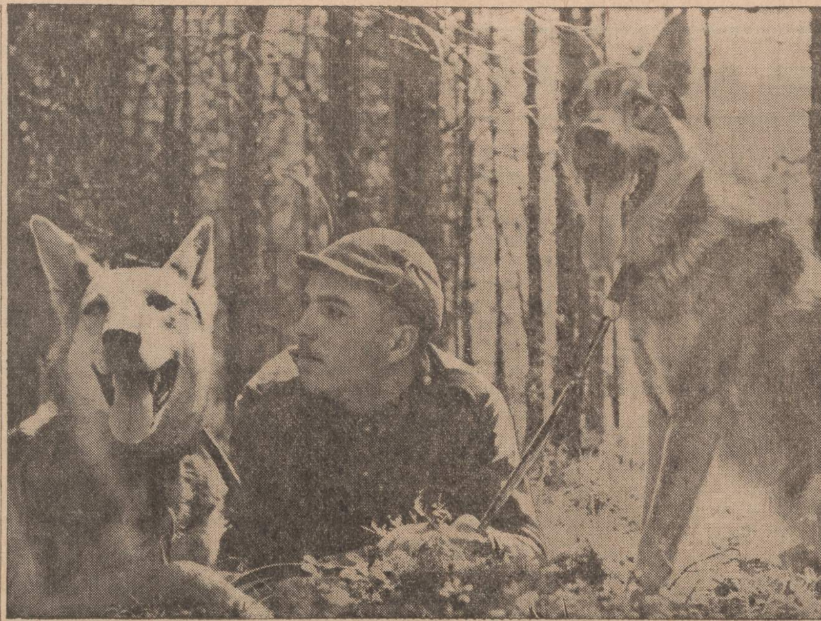
RYŠIŲ TARNYBOS DRAUGAI