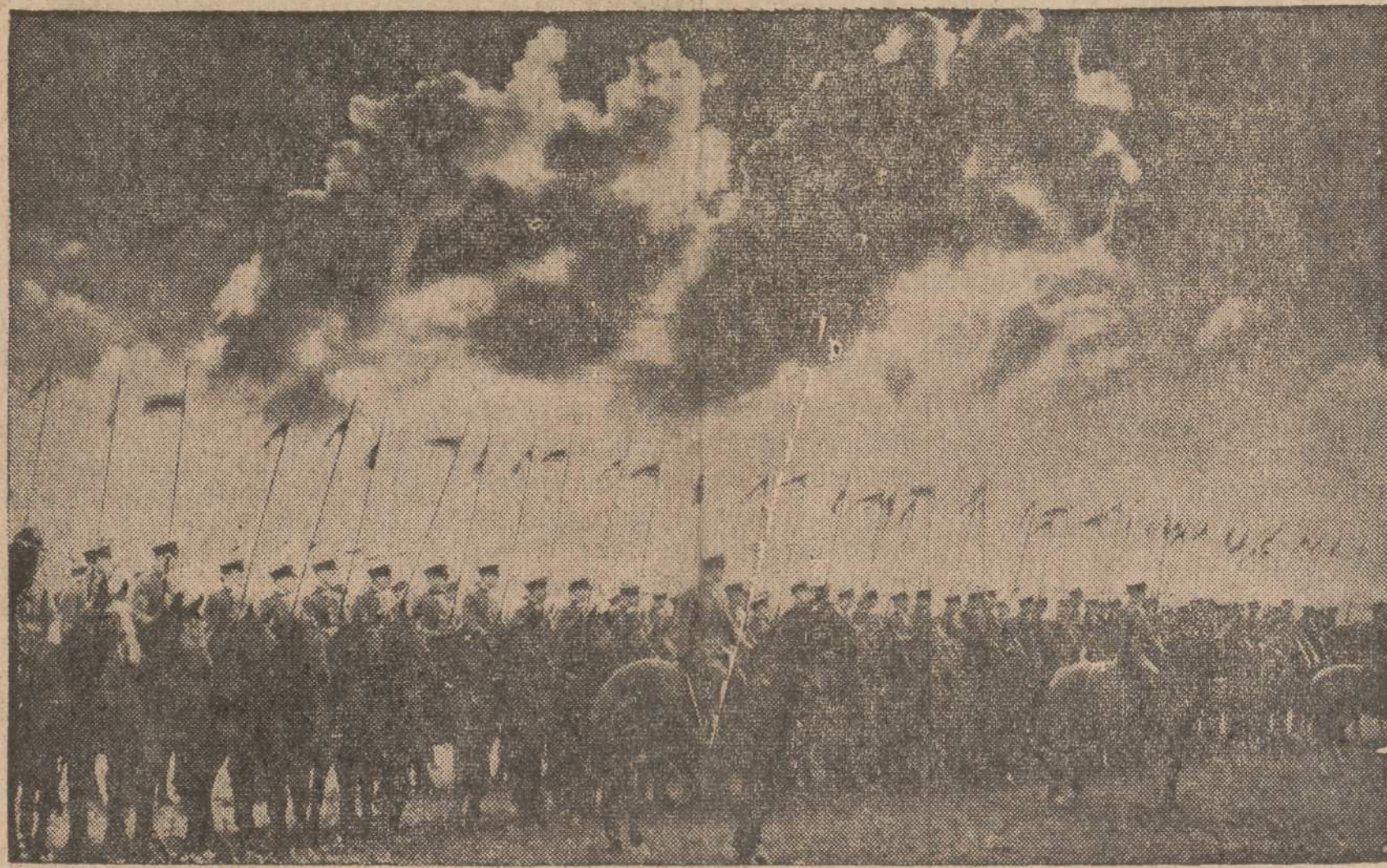
Šį savaitgalį Chicagoj ir kitose didesnėse lietuvių kolonijose Amerikoj bus minima Lietuvos kariuomenės diena, išpuolanti lapkričio 23-čią. Paveiksle matomas nepriklausomos Lietuvos kavalerijos dalinys parade.