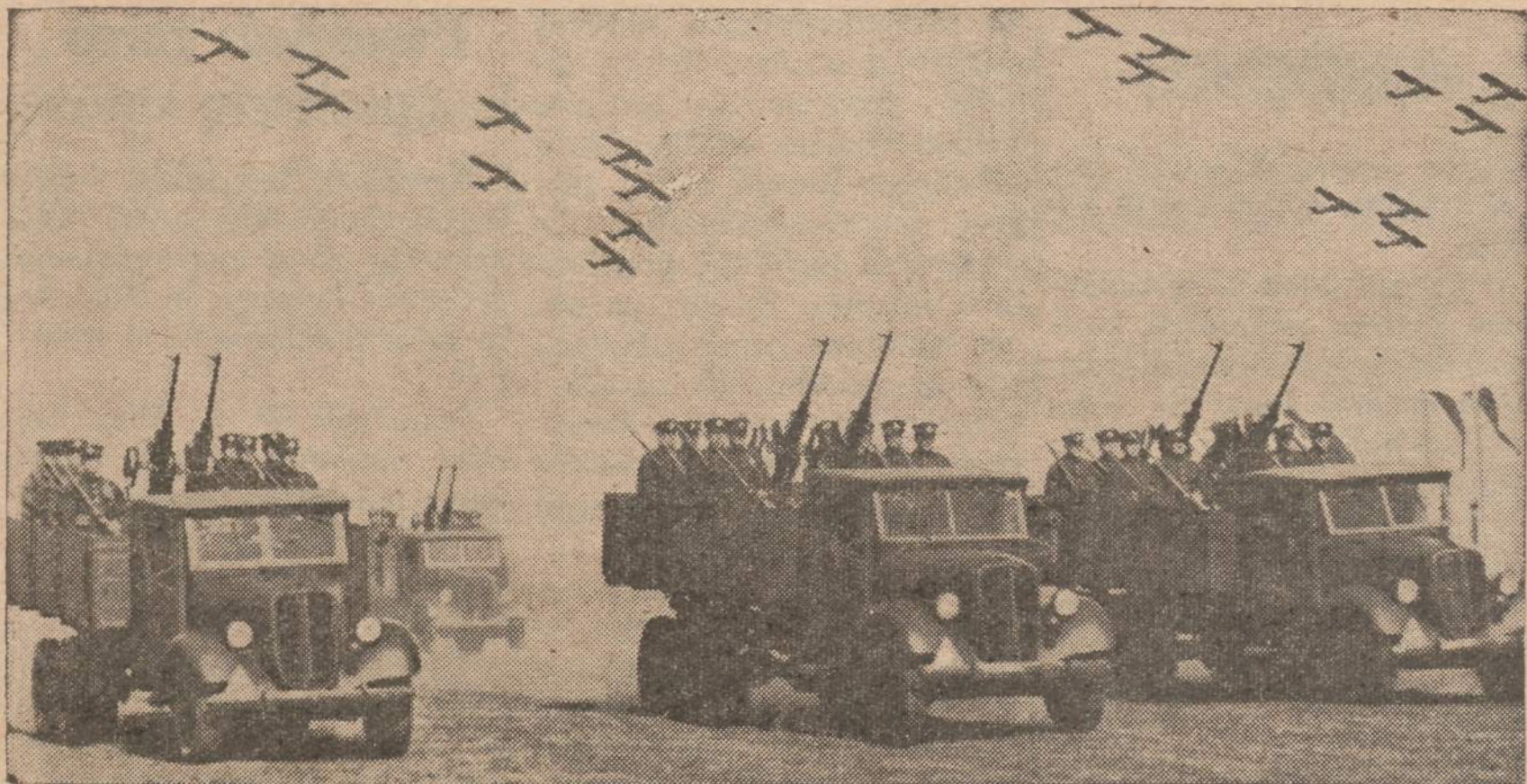
Lietuvos kariuomenė buvo gerai ginkluota pagal to meto karo reikalavimus. Čia matomas priešlėktuvinis dalinys.