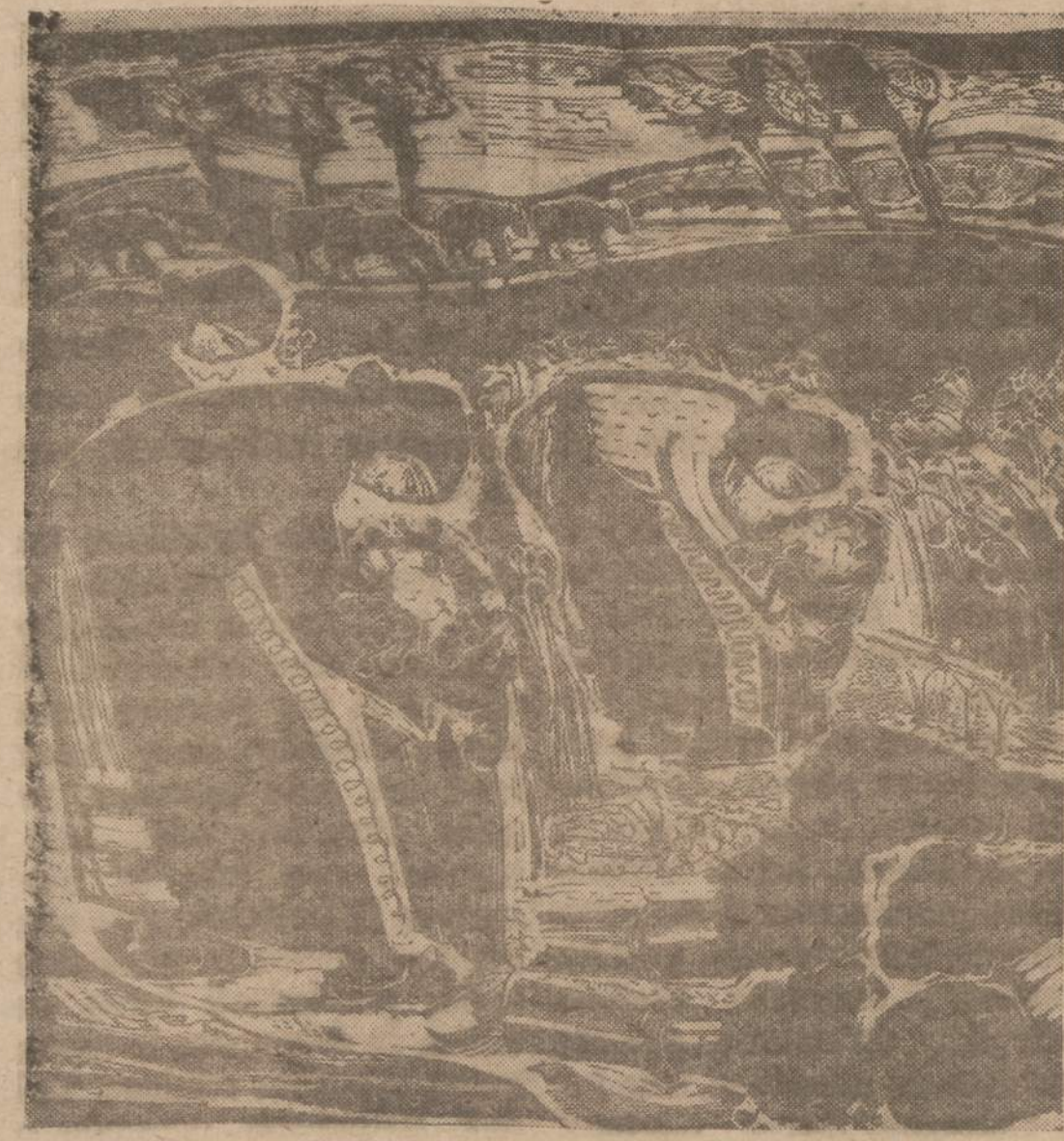
Dain. v. retravičiaus „Liny rovojės“, kurio individuali grafikos paroda yra Chicago Savings and Loan banko patalpose.

HARVEY AUTOMATIC TRANSMISSION SHOP Taisome automatinę transmisiją. Patikriname motora, atsukame klapanus. Pilnai su varkome stabdžius. Atvykę pas mus paminkite šį skelbimą. 15307 BROADWAY AVENUE (153rd at Broadway) EDison 1-9486 Harvey, III.