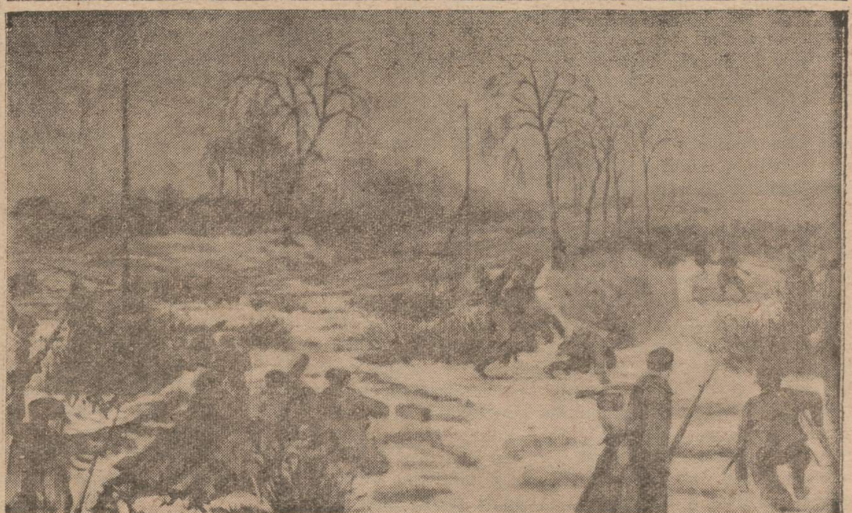
Iš nepriklausomybės kovų su Lietuvos priešais.

Plauks iš ruko kryžiai tėviškės eglėnuos, Rasoje paskendę mėlyni šilai... Bus sunku tikėti, Lietuva Tėvyne, Kad iš kraujo jūros Tu gyvent kilai, (Iš Lietuvos partizanų dainų)