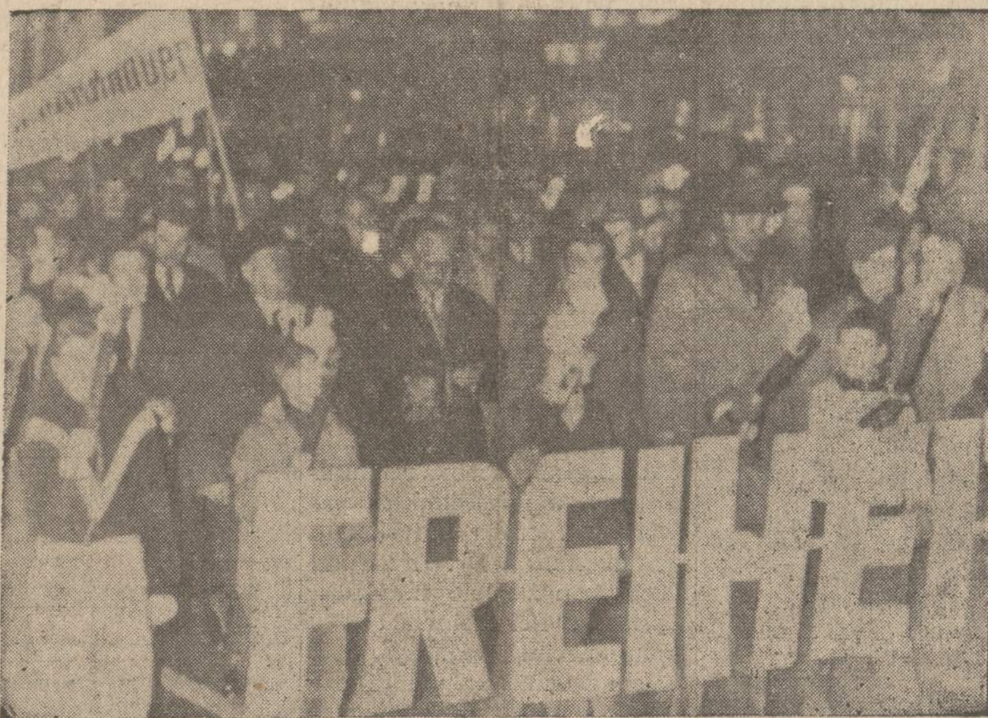
Keli tūkstančiai vakarų Berlyno gyventojų su žibintuvais surengė protesto parodą prieš komunistų „gelžinę sieną“, kuria vakarų Berlynas atskiriamas nuo rytų Berlyno. Demonstrantų priskyje eina ministris Ernst Lemmer (po kairei viduryje) ir Berlyno parlamento pirm. Otto Bach.

Dešiniaisiais ekstremistais, kuriuos anadien gvildeno prez. Kennedy, būvęs jo pirmtakas iš kitos partijos vadino reformatorius, siūlančius panaikinti mokesčius, uždrausti darbininkų unijas ir įvesti vienokios ar kitokios formos diktatūrą.