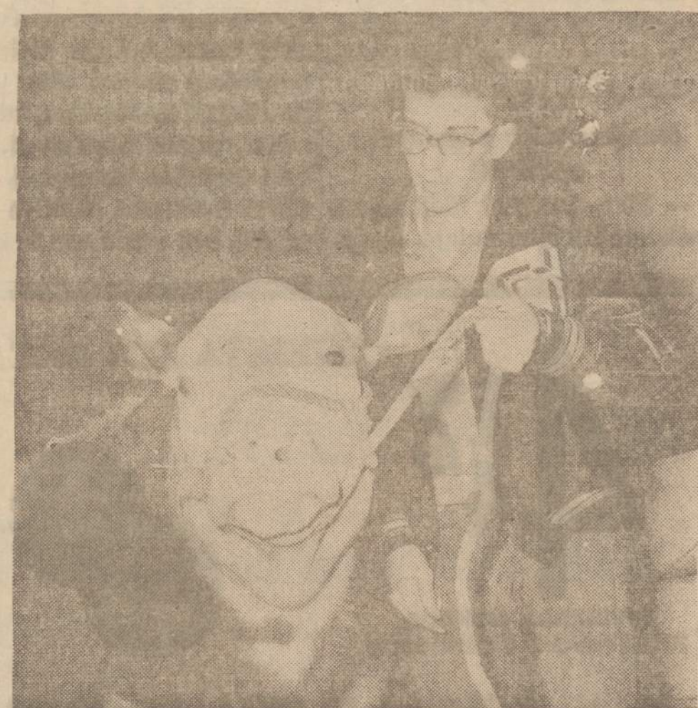
Chicagijoje rengiama tarptautinė gyvulių paroda vienas pirmųjų atvyko iš Goldthwaite (Tex.) jaunuolis Duren su savo "Pride" versiu.

SKAITYK PATS IR PARAGINK KITUS SKAITYTI NAUJIENAS JOS VISAD RAŠO TEISYBE