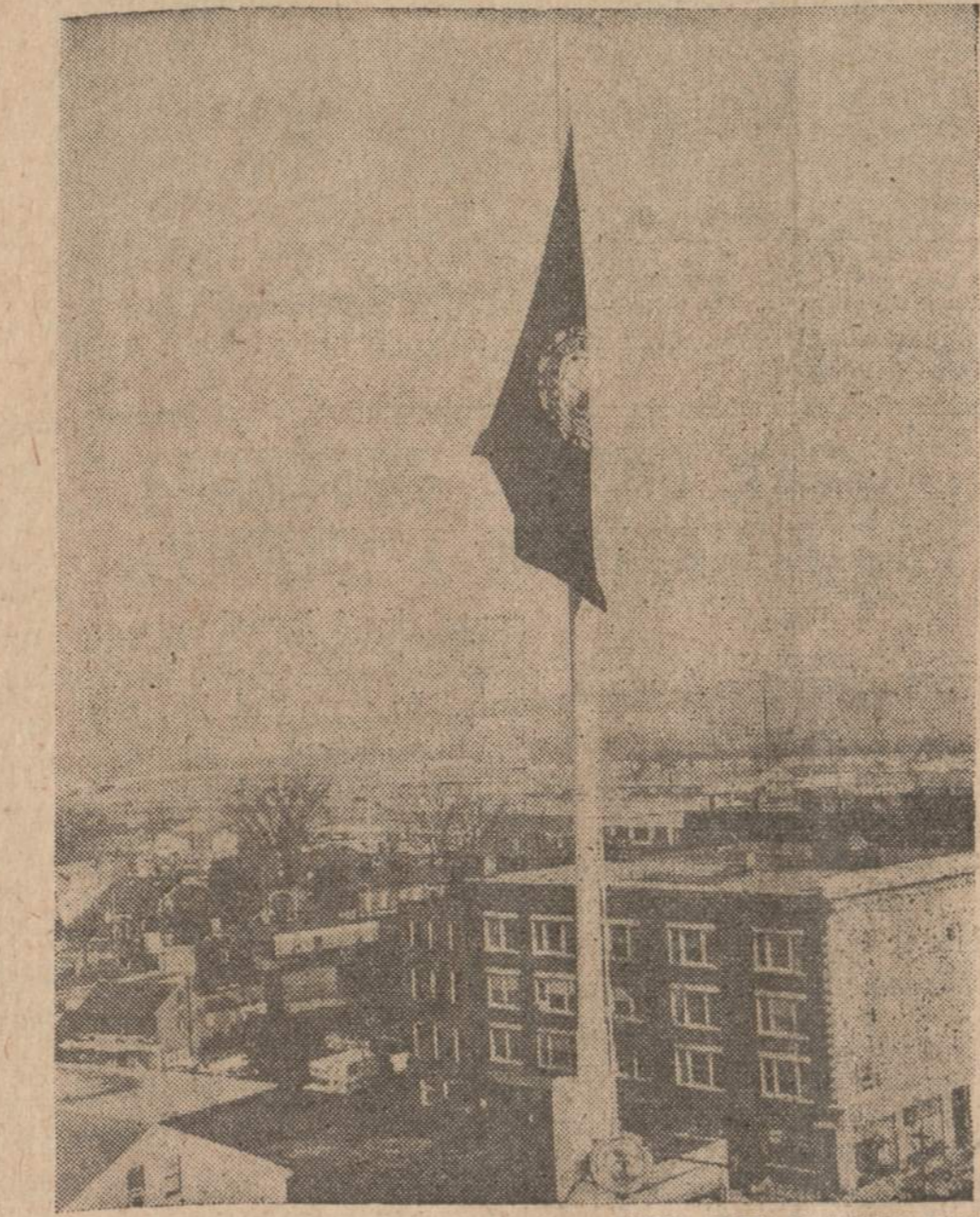
New Hampshire valstybės rūmuose (Concord mieste) buvo pusiau stiebo nuleista vėliava išreiškimui gedulo dėl mirties senatoriaus Styles Bridges, vieno stambiausio respublikonų vado.

Jis išvadino Sovietų politiką kolonijų atžvilgiu veidmainiška. Metodai buvę paprastai ir veiksmingi, bet šiurpuliniški 20-me amžiuje.