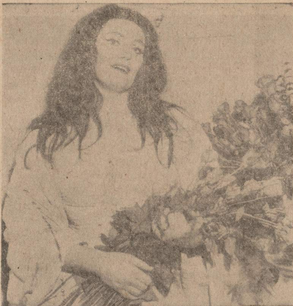
Australijoje gimusi dainininkė Joan Sutherland laiko gėtes, kurios jai buvo įteiktos po debiuto Metropolitan Operoje. Ji dainavo "Lucia de Lammermoor" operoje, sukeldama didžiausią entuziazmą, ir buvo iššaukta keturiolika kartų.

Atsakomingi miesto pareigūniai buvo įsakę apdegti namą sutaisyti, bet iki šio meto jis netaisomas. Paskutiniai mėnesiniai įvairūs valkatos išlaidos į