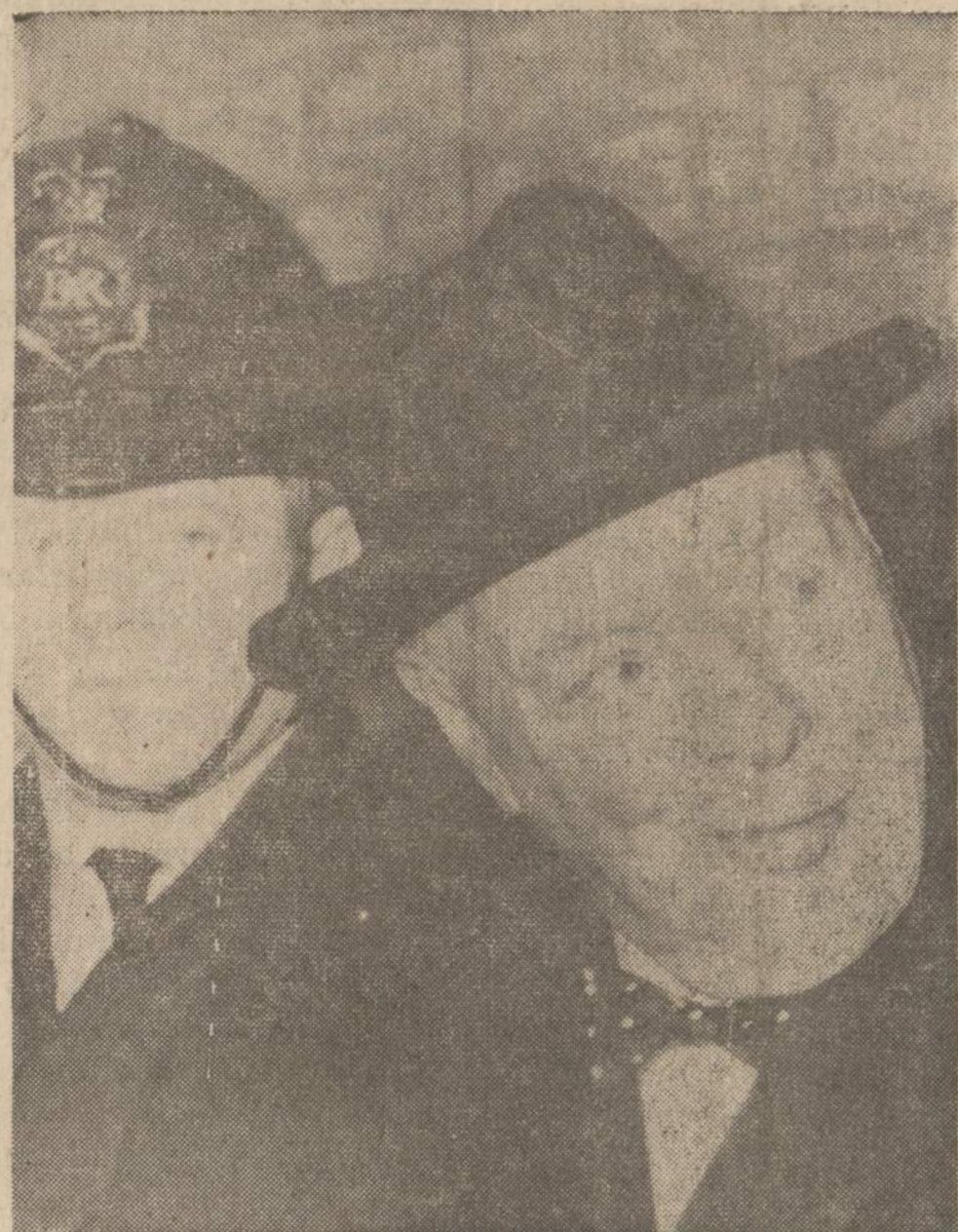
Sir Winston Churchill, Anglijos karo meto vadas, apleidžia savo namą Londone ir vyksta į Parlamento rūmus, kuriuos jis vadina savo "antrisiais namais". Churchillis paminėjo savo 87 metų sukaktį.

keliavimo suvaržymus Amerikos diplomatams, tarnautojams, korespondentams, Amerika atsilygintų tuo pačiu.