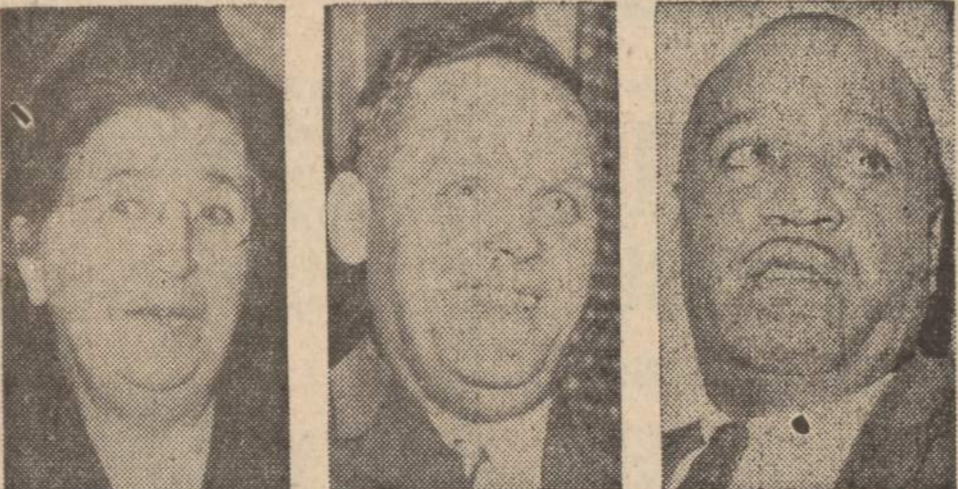
Amerikos komunistų partija pertvarkė savo vyriausią vadovybę, kurią sudarys tik trys asmenys: pirmininkė Elizabeth Curley Flynn (kairėje); generalinis sekretorius Gus Hall (viduryje) ir sekretorius Benjamin Davis. Kiti komunistų vadai vadovybėje nebeįtraukti. Tai padaryta, matyt, tuo tikslu, kad valdžia prie kitų vadų negalėtų kilti dėl nesiregistravimo sveimos valstybės agentais. Tokiu būdu valdžia galės traukti tiesios tik tuos tris asmenis.

— Anglijos lietuviai kraustosi kitur. Iš Manchesterio lietuvių kolonijos neseniai emigravo į Australiją ir Kanadą 10 lietuvių. Mažas skaičius lietuvių nuolat keliasi iš Didž. Britanijos į užjūrio kraštus.