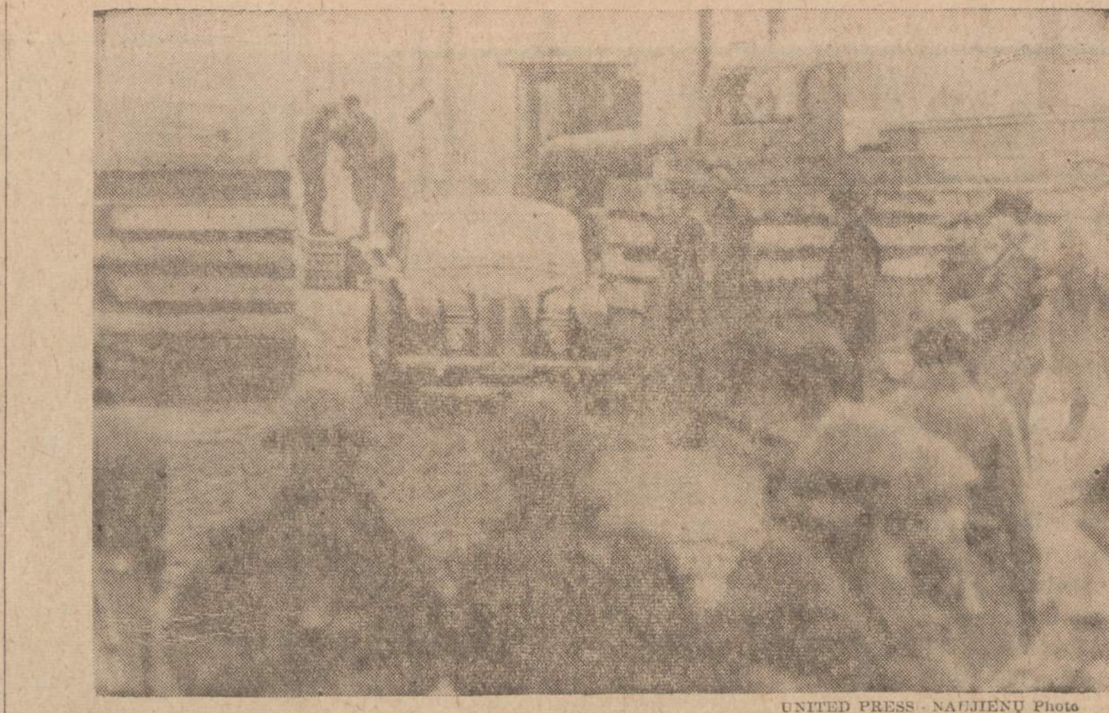
Diplomatinis automobilis įvažiuoja į Rytų Vokietijos zoną pro savotišką skylę Berlyno geležinėje sienoje.

— Teisybę pasakius, kaip dabar pagalvoju, tai ne tik tolimesnių giminių nemačiau, bet ir su pačiais artimaisiais neturėjau progos išsikalbėti. Parvažiuavau vėlai. Be to, smarkiai lijo. Lietus tiksliai vakare kiek apstojo. Vakare prisirinko pilnas namas. Kada su daugeliu kalbi, tai beveik su nieku nekalbi. Tada gali kalbėti tik apie bendrus dalykus. Visi klausia, o dažnai visi ir atsakinėja. Kai daug žmonių, tai tada ir klausimai menka-