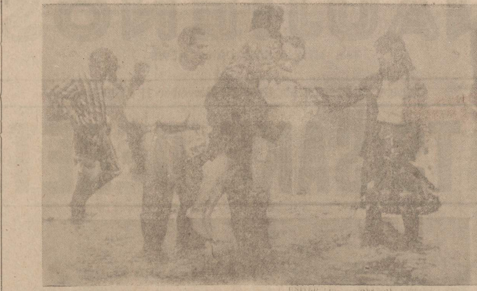
Po trijų dienų liūties Kairo, Egipte, gatvės buvo vandens apsemtos. Čia parodoma, kaip per vandens apsemtą gatvę vyras neša moterį.

Jusevičiai bene pusšimčiui ar daugiau garantijų atvykti į šį kraštą ir doleriais bei siuntiniais yra ne vienam nušluostę ašaras. Šiandien neieškime, kad Rockfordas būtų pamirštas. Iš-