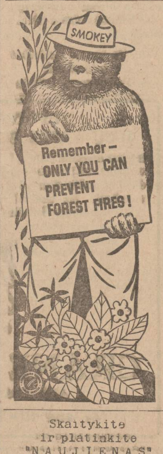
Skaitykite ir platinkite "N A U J I E N A S"