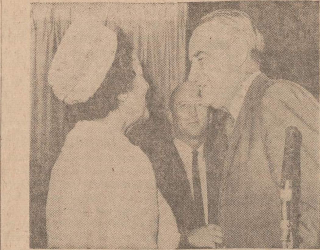
W. Averell Harriman, buvęs New Yorko valstybės gubernatorius, buvo prisiskindintas valstybės departamento Tolimųjų Rytų skyriaus viršininku. Šalia — jo žmona.