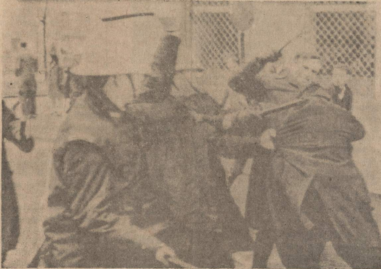
Belgijos policija Briuselyje vartoja lazdas prieš demonstrantus, susirinkusius prie Jungtinių Valstybių ambasados protestuoti dėl Jungt. Tautų veiksnių Katangoje. Apie 1,000 demonstrantų nesėsi plakatus, kuriuose smerkiamos JT ir prezidentas Kennedy. Demonstracija rėmė Katangos draugų sąjungą.

Tarp Austrijos ir Suomijos yra toks skirtumas, kad Austrija pasirašė taikos sutartį kartu su visais keturiais II pasaulinio karo nugalėtojais. O Suomijai taikos sutartis buvo užmesta Kremliaus be kitų šalių dalyvavimo.