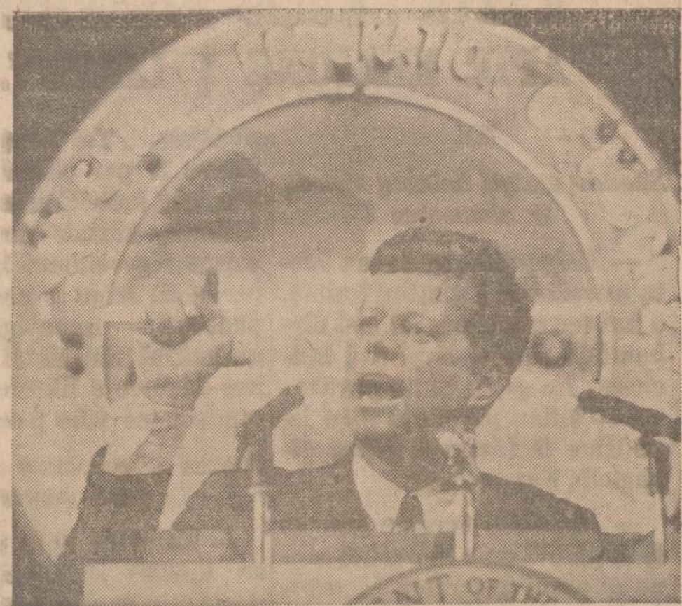
MIAMI BEACH, Fla. — Prezidentas John F. Kennedy AFL-CIO konvencijoje pasakė kalbą. Į konvenciją helikopteriu jis atskrido iš Palm Beach, Fla.