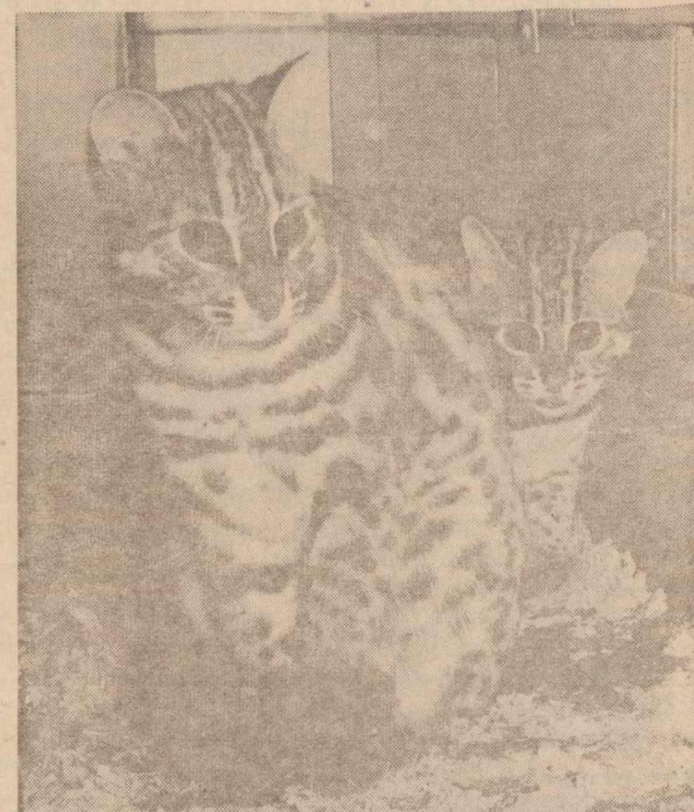
Azijos tigrinė katė su prieaugliu Lincolno zoologijos parke

SKAITYK PATS IR PARAGINK KITOS SKAITYTI NAUJIENAS JOS VISAD RAŠO TEISYBĖ