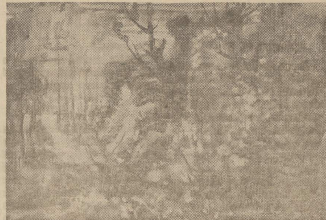
Dail. Ad. Galdikas — "Peisažas"