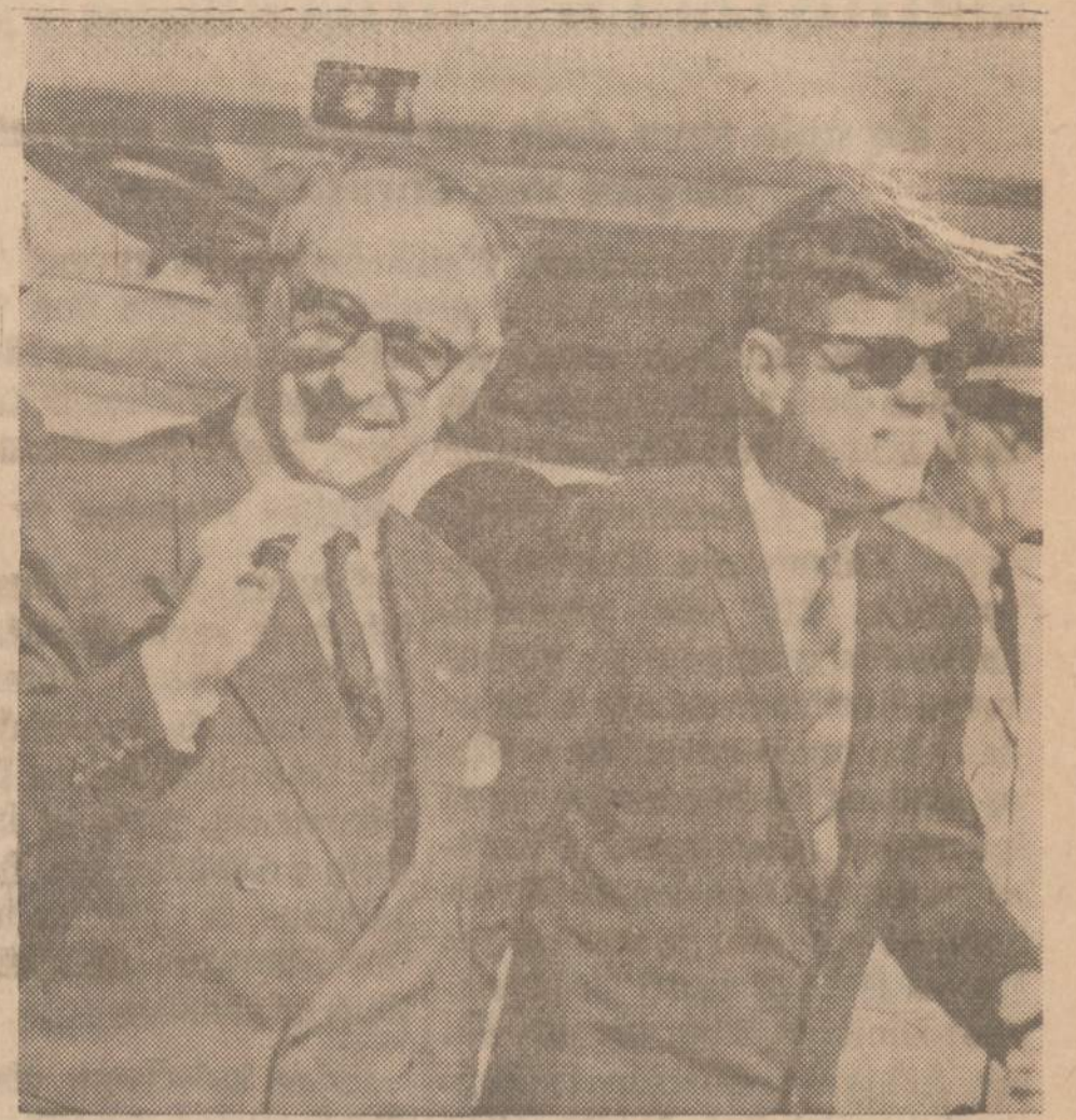
Prezidentas Kennedy susitinka Argentinos prezidentą Arturo Frondizi, atskridusį į West Palm Beach aerodromą.

Londono universiteto psichiatros profesorius H. J. Eysenck išdėstė naują teoriją apie tabaką, pareikšdamas, kad rūkioriai yra daug nervingesni (pasiduoda emocijoms) negu nerūkantieji, yra daug didesni neotritikai, kurie daugiau negalauja, daugiau geria, daug neatsargiau automobilį vairuoja ir daug dažniau ieško skrybių. Bet jie yra daug sociališkesni, tai yra labiau mėgsta žmonių draugystę. Rūkioriai daugiau rūpinasi,