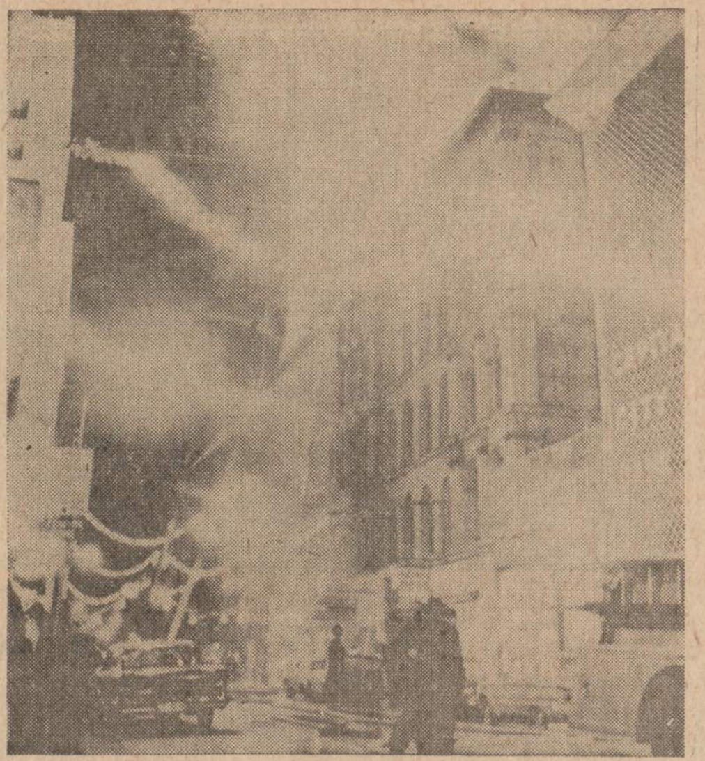
NASHVILLE, Tenn. Gaisras sunaikino istorišką Maxwell House viešbutį, kuriame savo laiką buvo sustoję net septyni Amerikos prezidentai. Gaisrininkai šėsis valandas kovojo, bandydami gaisrą sulaukyti, tačiau jų pastangos nulejo niekais.