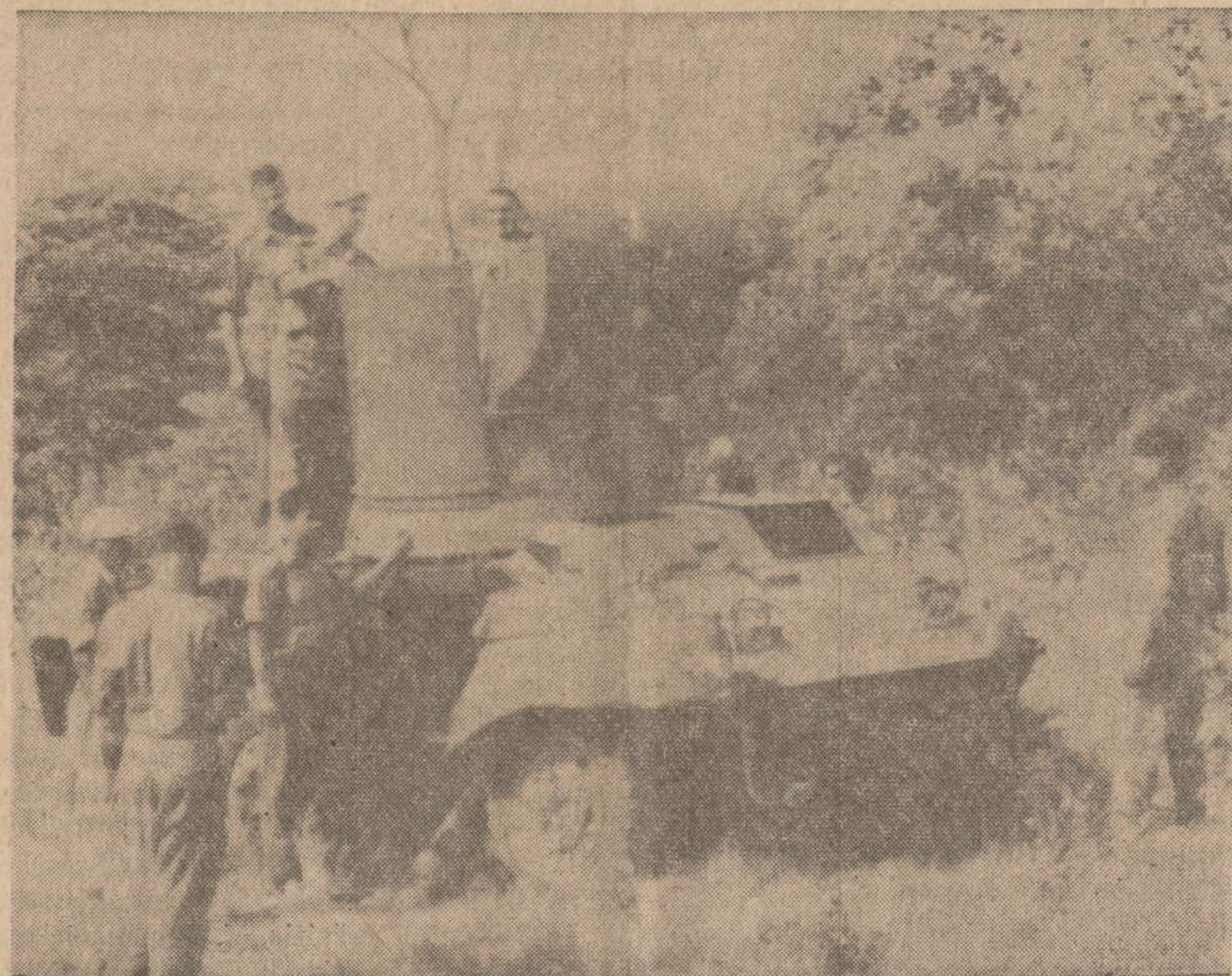
Elizabethville priemiestyje Indijos kariuomenė, kuri sudaro Jungtinių Tautų ginkluotųjų jėgų dalį, apžiūri šarvuotą sunkvežimį, kurį paliko pasitraukusi Katangos kariuomenė.

— Klaipėdos "Dailės" kombinatas išsiuntė į Braziliją siuntą meniškių gintaro dirbinių bei papuošalų. Šie dirbiniai bus eksponuojami Rio de Janeiro organizuojamoje Sovietų Sąjungos pramonės ir prekybos parodoje.