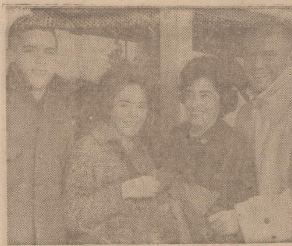
Astronautas pulk. leit. John Glenn grįžo iš Cape Canaveral i namus (Arlington, Va.) praleisti Kalėdas drauge su savo šeima. Šio sesuio viduryje yra paskirta jam iškristi raketoje į orbitą aplinkul žemę.