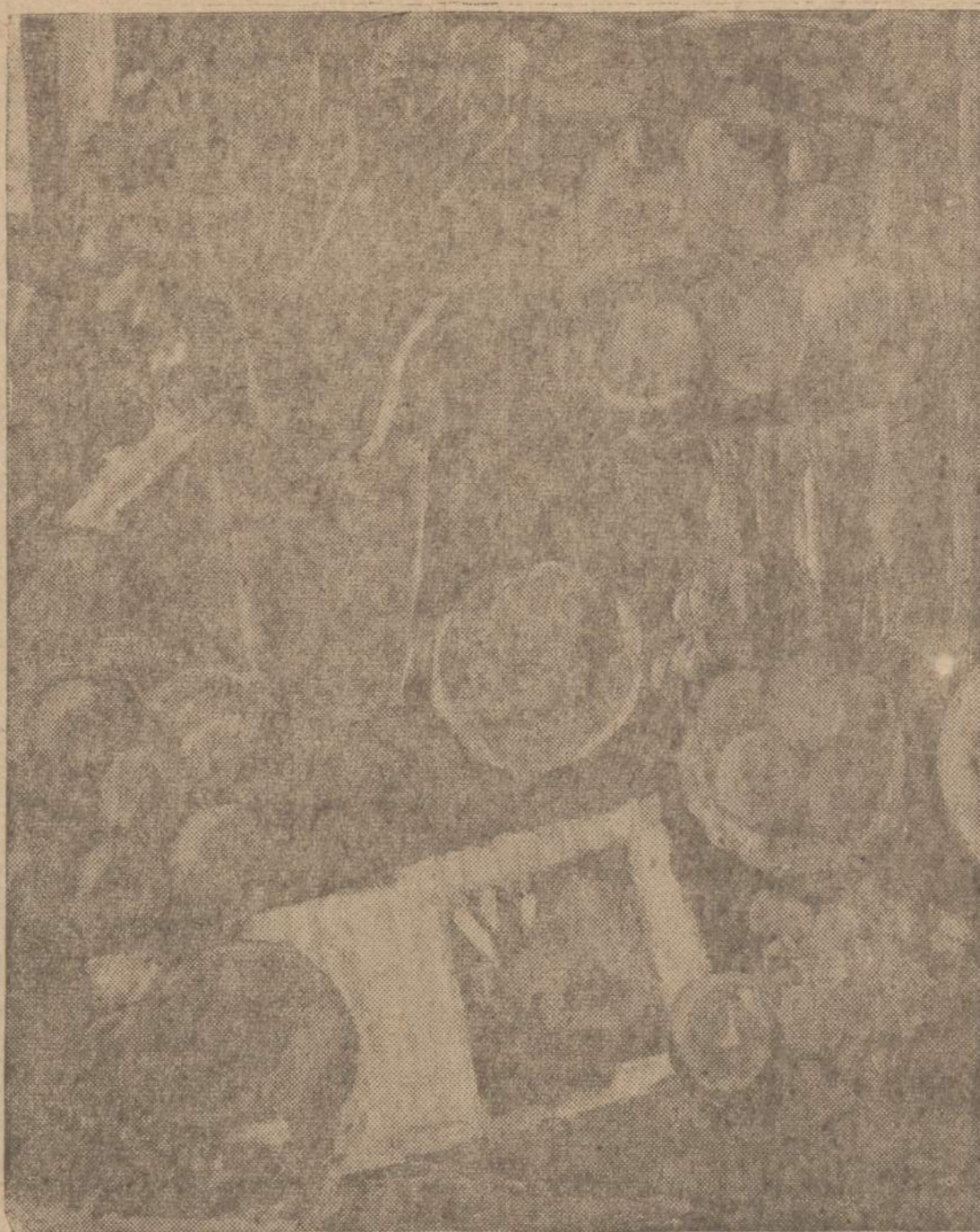
(Čiurlionio Galerijos nuosavybė)

Su pinigų vis dėlto yra susištis ir menas ir mokslas ir religija, — nieko nepadarysi, bet šią problemą tenka spresti taip, kaip yra sprendžiama gerio ir blogio klausimas, — kaip etikos ir moralės apsprendžiama klausimai. Dailės kūrinys estetiškai gali būti geras, bet moraliai blogas arba atvirkščiai. Cinizmas dailėje, kinė ir žemos moralės leidiniuose išdykėlius padaro išdykesniais, o tamsius — tamsesniais. Menas — jokia religija, kuris mokytų doros, bet jis nėra irankis moralei smukdyti. Menas turi tarnauti aukštom idėjom ir estetiniam grožiui, kuris skaitina, bet ne purvina žmogaus morale. Kilni muzika mūsų dvasią perkelia į moralinę stip-