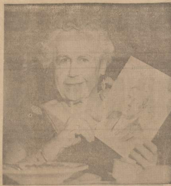
Mrs. Woodrow Wilson, buvusio JAV prezidento žmona, mirė Wa- shingtone, sulaukusi 89 metų amžiaus.