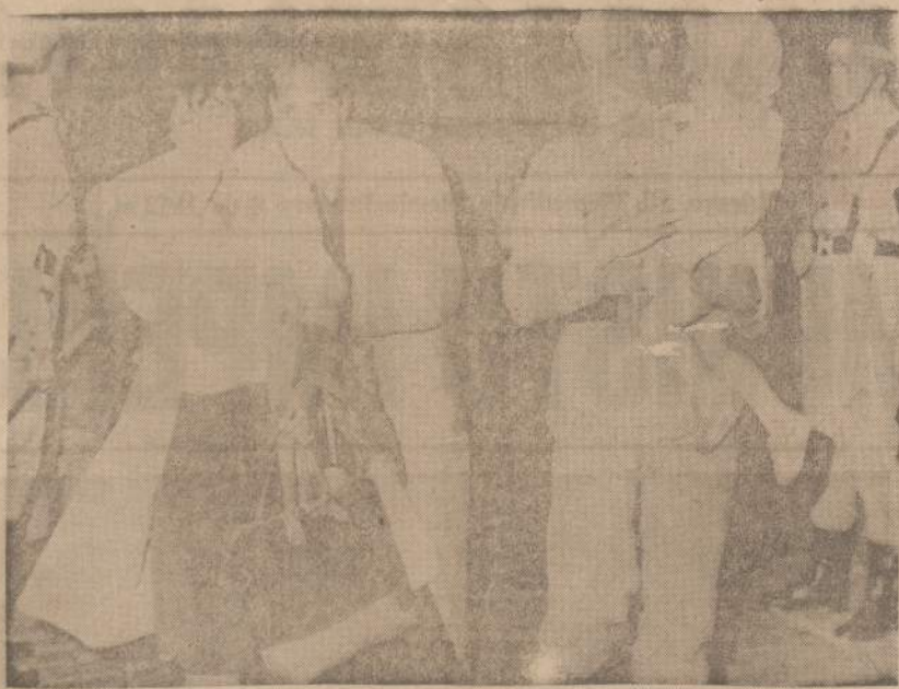
Portugalų karys neša verkiandžių pabėgėlių kūdiki. Tai pabėgėliai iš buvusios Portugalijos kolonijos Goa, kurie "India" laivu atplaukė į Lisaboną.

Vakare išvykome ir, tur būt, kokis vaiduoklis ėmė mus ir suklaidino. Atsiradome didokame kaime. Perlipę per tvorą, ir daržais, per užpakalines vieno ūkininko namo duris, visi trys užėmame į trobą. Įėjus į vidų, ūkininkas lietuviškai suriko: "Vyrai pilna stacija (Rytų Lietuvoje ir Vilniuje antrąją namo dalį, seklyčia, vadindavo stacija) lenkų. Nešdinkitės greičiau iš čia". Aš visas iš baimės apmiriau ir kaip stovėjau pirmas prie durų, taip ir sprukau pirmas pro duris į lauką. Iššokęs pro duris į lauką, kaip negyvas kritau į patvoryje esančias aukštas dilgeles. Puskarininkis su kareiviu taip pat pasikui mane norėjo išbėgti, bet kaip tik tuo laiku atsiradė seklyčios durys ir tarpduryje pasirodė didelio ūgio lenkų karininkas. Puskarininkis kaip turėjo užtaisęs rankinę granatą, taip ją ir paleido į seklyčios vidų. Pasigirdo tik didelis bumpt ir lenkų blyovimas. O kareivis dar porą šūvių paleido. Patys pro duris smuko į lauką. Tuo