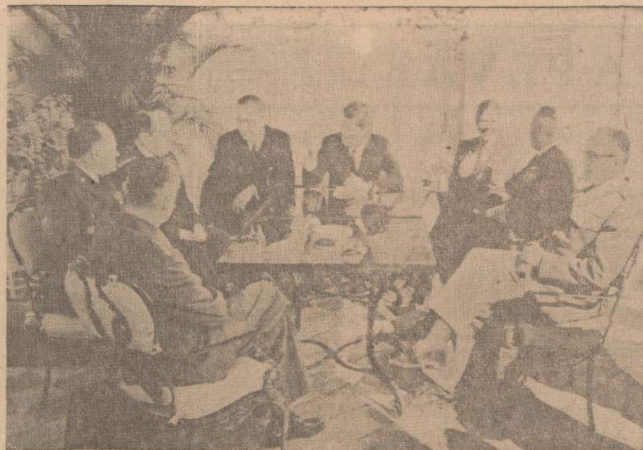
Prezidentas Kennedy Palm Beach (Fla.) rezidencijoje posėdžiavo su gynybos vadais. Žiūrint pagal laikrodžio rodyklę: generalas Frederick Smith, oro jėgų štabo viršininkas; generalas Lyman Lemnitzer, štabo viršininku pirmininkas; viceprezidentas Lyndon Johnson; prezidentas Kennedy; gynybos sekretorius Robert McNamara; admiralas George Anderson, laivyno operacijų vadas ir generalas David M. Shoup, marinų vadas.

"NAUJIENAS" SKAITO VISŲ SROVIŲ ŽMONES: DARBININKAI, MOKSLININKAI, VALSTYBININKAI, DVASININKAI, PROFESIONALAI IR BIZNININKAI. JIE ŽINO, KAD NAUJIENOS PADUODA TEISINGIAUSIAS ŽINIAS IR GERIAUSIAS RAŠTUS.