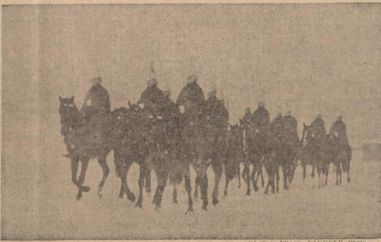
Karališkosios raitelių sargybos paradas Londone, iškritus gerokai sniego.