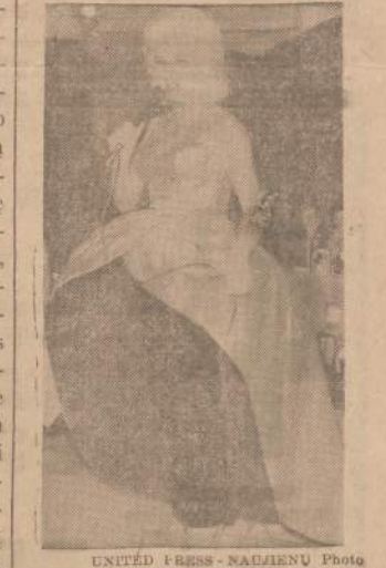
Diana Dors, Anglijos klubų "Zavignum karalienė", vis dar pasirodanti klubų programose. Kadangi ji netrukus laukiasi kūdikio, tai pasiūdinuo sau specialius drabužius.

"NAUJIENAS" SKAITO VISŲ SROVIŲ ŽMONES: DARBININKAI, BIZNIERIAI, PROFESIONALAI, DVASININKAI, VALSITYBININKAI, MOKSLININKAI JIE ŽINO, KAD "NAUJIENOS" PADUODA TEISINGIAUSIAS ŽINIAS IR GERIAUSIAS RASTUS