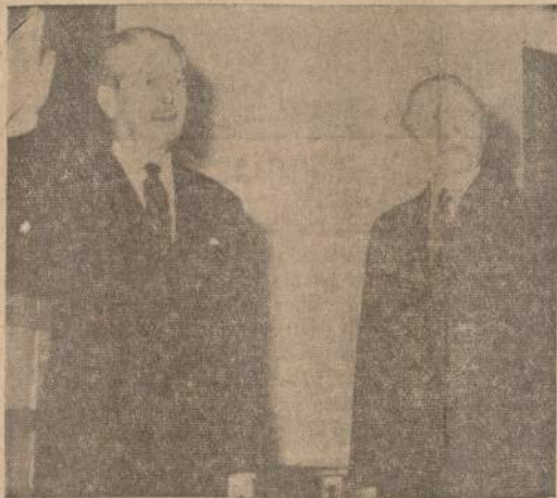
Anglijos premjeras Harold Macmillan ir Vakarų Vokietijos kancleris Konrad Adenauer (dešinėje) Schaumburgo rūmuose, Bonnoje.