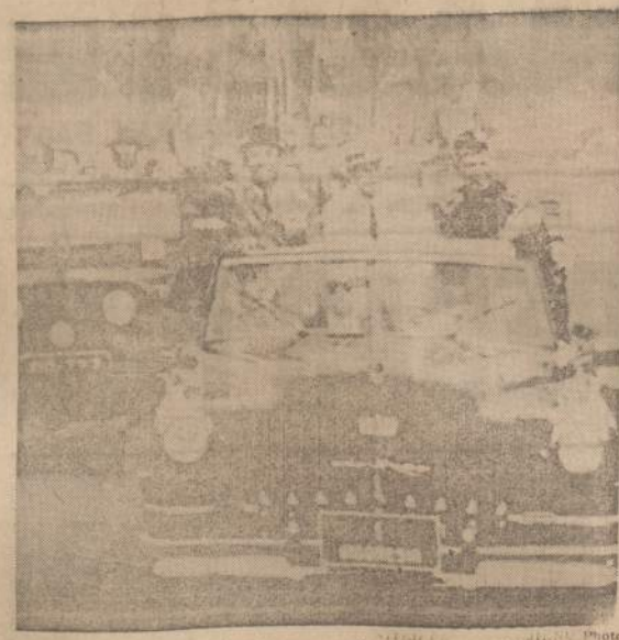
Indonezijos prezidentas Sukarno važiuoja automobiliu Makasar (Indonezija) miesto gatve ir musikuoja mini. Kartu su juo važiuoja Sovietų astronautas German Titovas, apsirėngęs balta uniforma.

Išverstskūris rašo, kad nuo pernai klubas pradėjęs duoti dvi vakarienes. Pons, šauni pro ša. Tai yra daroma jau ne nuo „pernai“, o beveik nuo pat klubo įsikūrimo. Klubas šeimyniški parengimai yra daromi ne dėl „privalgyk“ ir „prisigerk“, bet dėl bendro susipažinimo ir glaudesnio susijungimo tarp naujųjų ateivių ir senųjų. Per šeimyninius klubo banketus jokios muzikos nesamdoma ir niekas