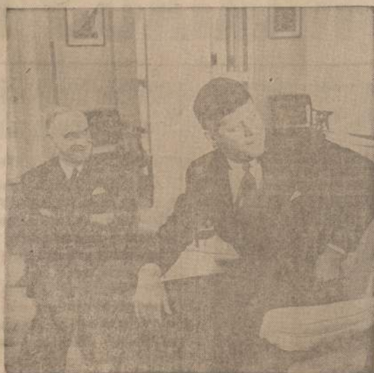
Prezidentas Kennedy ir jo asmeninis atstovas Berlyne, generolas Lucius D. Clay, nusifotografavo Baltuosiuose Rūmuose, kur juodu konferavo. Po konferencijos Prezidentas pareiškė, jog pasitarimas baigsis visišku susitarimu ryšium su politika, kurios bus laikomasi ateityje Berlyno klausimu.

— Namai puikus, įrengimai moderniški, bus malonu juo-