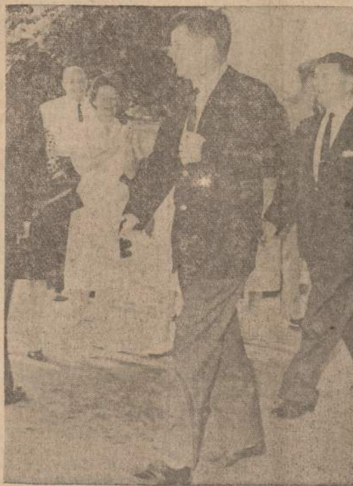
Prezidentas Kennedy, aplankęs savo tėvą West Palm Beach ligoninėje, grįžo atgal į Washingtoną.

Havanos universiteto rektorium paskirtas komunistų partijos pirmininkas Juan Marinello. Kiek anksčiau jis buvo paskirtas literatūros profesorium.