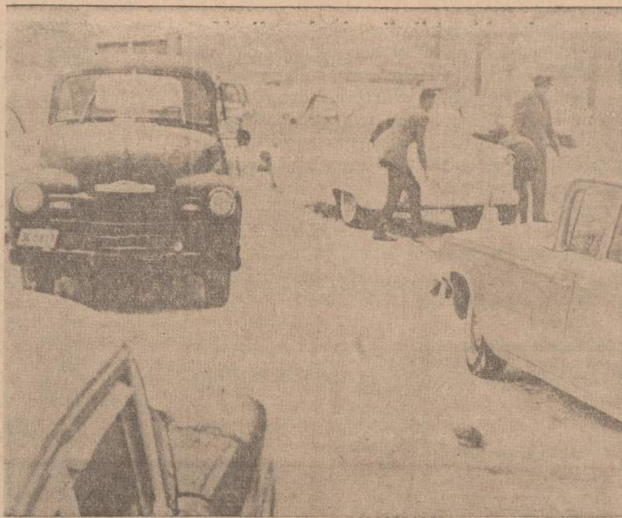
Dallas, Texas. Sniego ir ledo padengtos gatvės tiek suparalyzavo judėjimą, jog darbininkai pavėlino dvi valandas atvykti į darbotvietę.