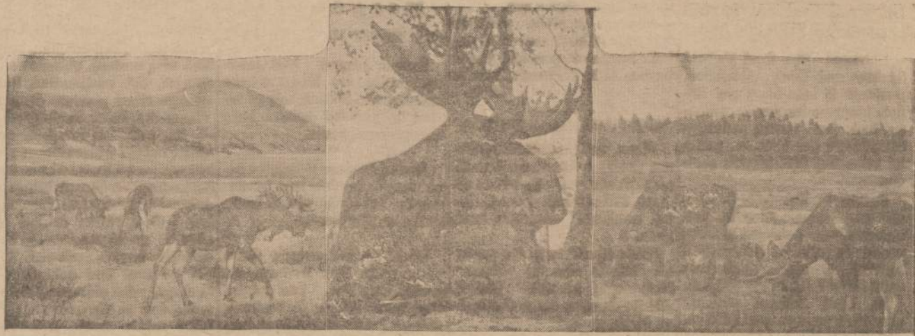
BRIEDZIAI PLAČIARAGIAI NERINGOJE