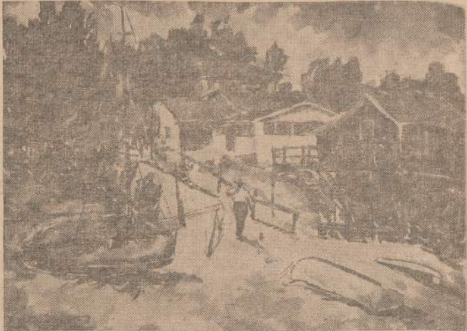
Dail. Br. Murinas — "Vasarnamiai"

Dail. Alb. Elskaus Maino uolų tapybos ir piešinių paroda Chicago Savings banko galerijoje rytoj baigiasi.