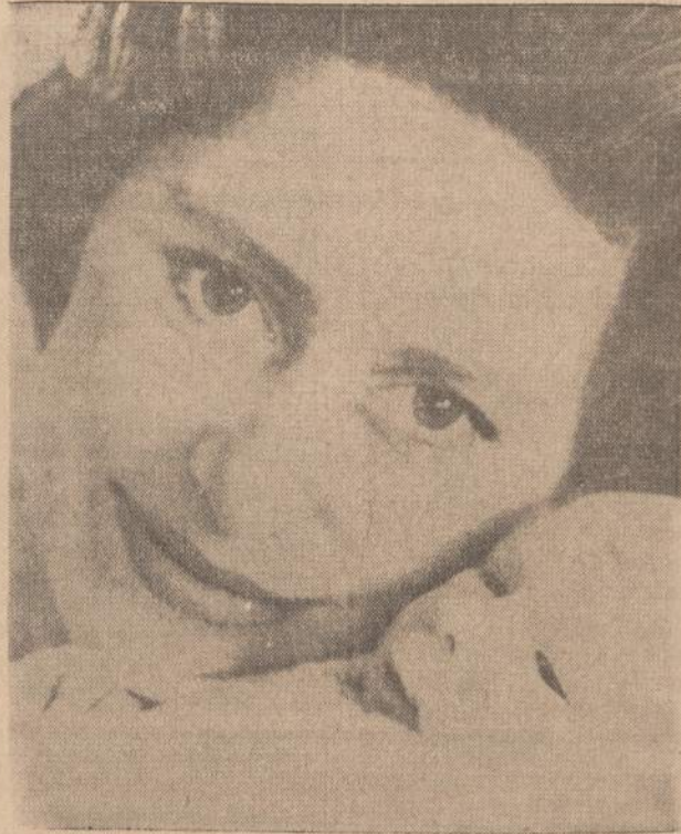
Kaip šis vaikas bus auklėjamas? — Montessoriškai ar Alvudiškai...

Pedagogikos mokslas nurodo daugelį priežasčių, kodėl Montessorinis metodas neatsako šių dienų atitinkamam mokslui; viena kitą jų čia aš paminėsiu. Entuziastai kalba, girdi, Montessori darželiuose vaikai patys auklėjasi ir patys pataiso savas klaidas — tai pagrindinis daly-