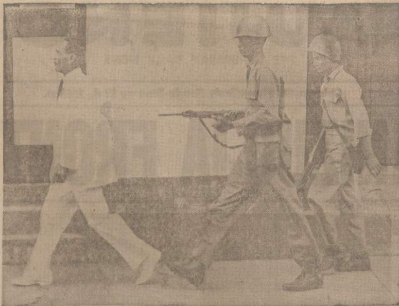
Du kareiviai veda įtariamą diktatoriaus Trujillo šnipą, kurį buvo užpuolusi minia Santa Domingo mieste (Dominikonų respublikoje).