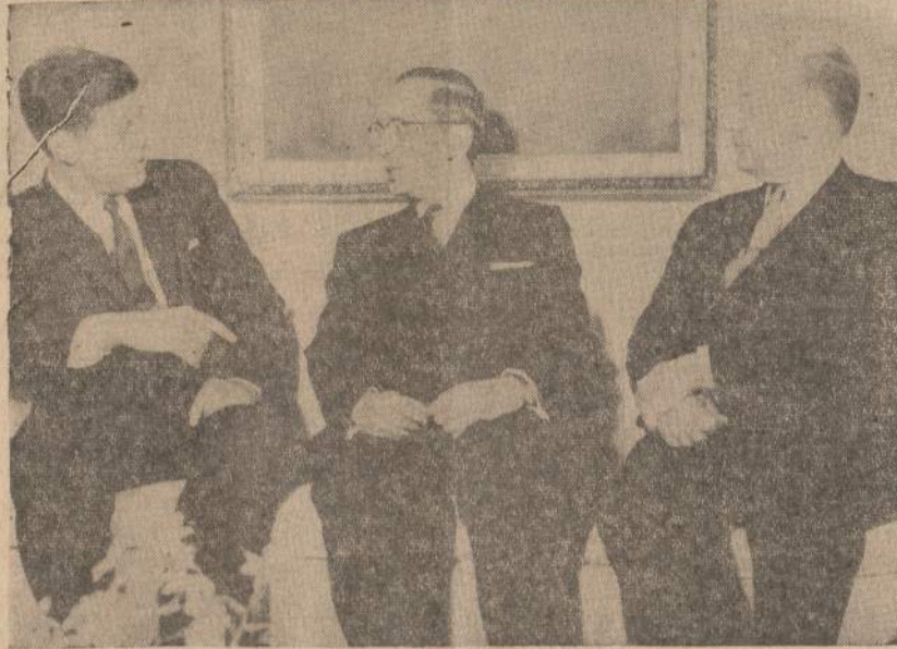
Prezidentas Kennedy, Jungtinių Tautų Generalinis sekretorius U Thant ir ambasadorius Adlai Stevenson penktadienį aptarė New York'e, Waldorf-Astoria viešbuty pasaulio taikos problemas.

(E) Siekiant Lietuvos gyventojus atbaityti nuo religinių „atgyvenų“ — Kalėdų švenčių rengimo, vadinamos naujameitės eglutės įvairiuose Lietuvos klubuose, kultūros namuose, mokyklose sužibo tik Naujų Metų išvakarėse. Ta proga buvo surengtos eglutės šventės ir, sovietiniu papročiu, mažieji gavo ne kalėdines, bet naujamietines dovanėles iš... senio šalčio. Sausio pirmomis dienomis eglutės šventė buvo suorganizuota Vilniaus universiteto aktyvumo salėje ir joje apsilankė daugiau kaip 16.000 vilniaus mokslievių.