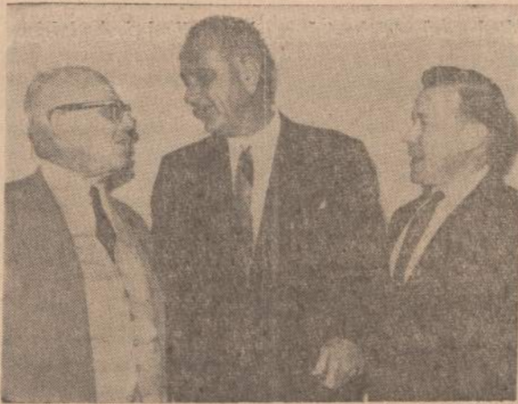
Washington, D. C. — Viceprezidentas Lyndon Johnson (viduryje), George Meany (kairėje), AFL-CIO prezidentas, ir Walter Reuther ekonominiame AFL-CIO konferencijoje.