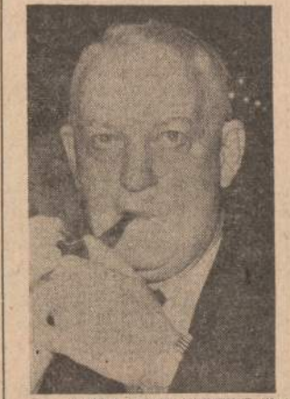
Admirolas Arleigh Burke, buvęs laivyno viršininkas, sako, kad kariškiai turi teisę kalbėti prieš komunizmą, jei tik jie vengia partijų politikos ir gerbia civilinę kontrolę.

Sovietų partinis ir valdžios šefas savo kalboje puolė "pasejusius ir neplaningus metodus" gyvulininkystėje. Jam nepatiko, kad gamyboje per mažai dėmesio kreipiama į materialinę paskatinimą. (E)