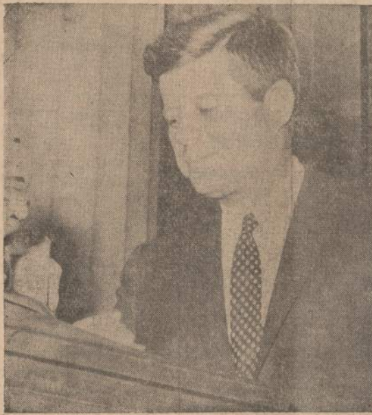
Prezidentas Kennedy, kalbėdamas pieno pramonės atstovų konferencijoje Washington'e pareiškė, kad pienas yra geriausias maisto produktas ir kad jis įsakė nuo šiol duoti pieną prie visų valgių Baltajame Name. Kalbėdamas prezidentas rankose laikė pripilta pieno stiklą.

Buvęs prezidentas sako, kad Sovietai būtų labai patenkinti, jei JAV vyriausybė uždraustų savo kariškiams dalyvauti visuomenės antikomunistiniame švietime.