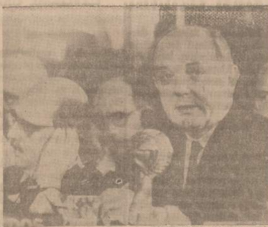
Valstybės sekretorius Dean Rusk (dešinėje) kalba Amerikos Valstybių Organizacijos konferencijoje, kuri vyksita Punta Del Este, Urugvajuje. Savo kalboje Rusk pabrėžė, kad Kuba turi būti pašalinama iš Organizacijos, kuriai dabartiniu laiku priklauso 21 Amerikos valstybė.