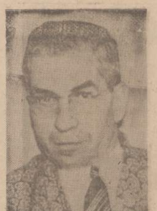
Charles "Lucky" Luciano, savo laiką buvęs New Yorko paduogiu ir gongsteriu valdovas, nelikusiai mirė Neapolyje (Italijoje) aerodrome, be laudamos iškėtu.