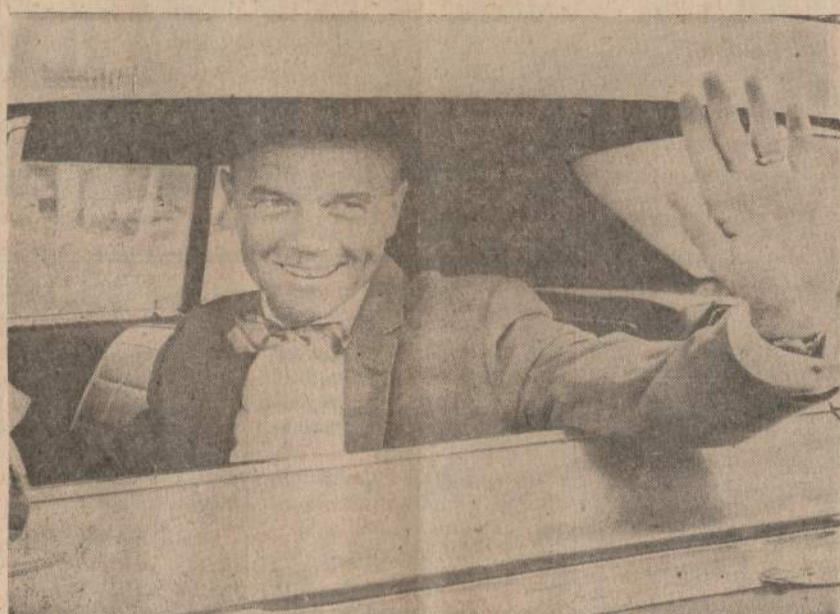
Astronautas John Glenn mosikuojantis iš savo automobilio Cocoa Beach, Floridoje. Tikimasi, jog vasario 1 ar 2 d. jis bus raketos pagalba paleistas į erdvę, kad apskristų tris kartus aplink žemę.

Skrypnik buvo Ukrainos švietimo komisaras nuo 1925 iki 1933 metų. Jis kalbėdavo apie