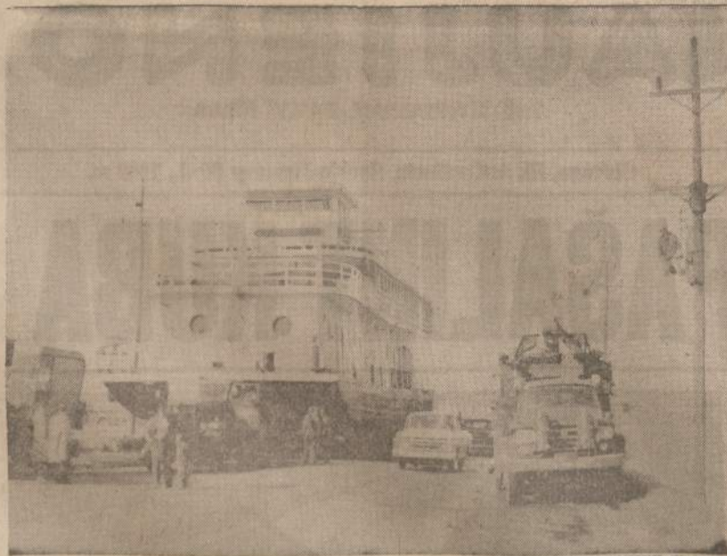
Keturiasdešimt tonų upės laivas yra vežamas į St. Louis priemiestį, kur jis bus paverstas restoranu. Tai jo paskutinė kelionė. Mississippi upė jis pradėjo plaukiooti 1900 m.