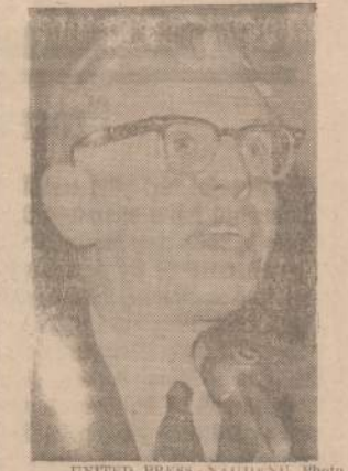
Senato - Kongreso komiteto darbo sekretorius Arthur Goldberg pranešė, jog sausio mėnesį nauji bedarbių skaičiai pasiekė 572,000. Tokiu būdu iš viso bedarbių dabar yra 4,663,000. Tačiau pagal Goldbergą, bedarbių padidėjimas esąs mažesnis, negu paprastai yra sausio mėnesį.

Jau pradėdama kalbėti apie įvairius sąlygų pagerinimus. Minėtame Maskvos pasitarime Chruščiovas net nurodė pavyzdžius iš kapitalistinio pasaulio žemės ūkio (JAV, Olandijos, V. Vokietijos ir kt.). Kremliaus valdovas ta proga ir išsitarė, kad "mums reikia pasimokyti iš mūsų priešų — kapitalistų...". Maskvoje įvykęs kom. par-