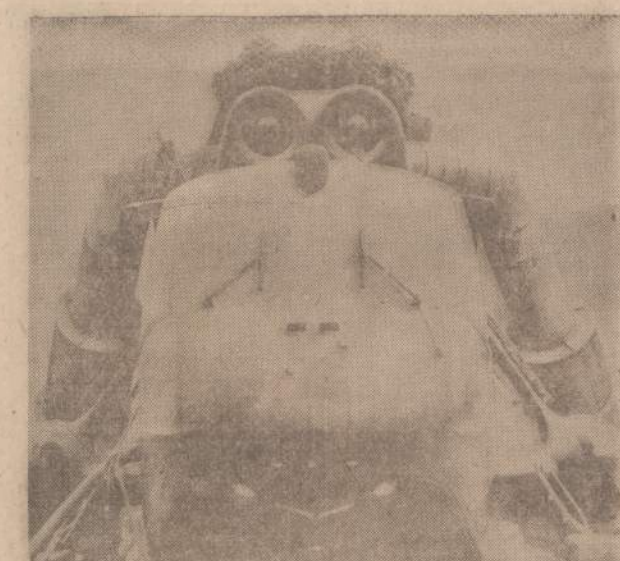
Geriausias laivyno helikopteris, kuris uagar yra išbandomas Elgin aviacijos bazėje, Floridoje.