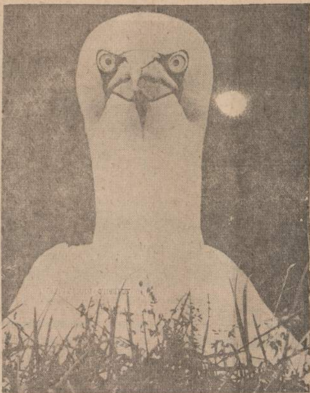
Chicagos Gamtos Istorijos muziejuje šiuo metu vyksta 17-ji tarptautinė gamtos fotografijos paroda. Čia matomas "susimastęs" ganytojas yra didelis ūru paukštis, kuris prisilaiko Atlanto vandenyno šiauriniuose pkrasčiuose ir užaugęs turi iki 6 pėdų nuo vieno sparno galo iki kito.

BRIGHTON SAVINGS AND LOAN ASS'N. 4071 ARCHER AVENUE, CHICAGO, ILL. Lafayette 3-8248 Sekretorius CHARLES ZEKAS Valandos: Kasdien nuo 9 ryto iki 4:30 po pietų. Ketvirtadieniais nuo 9 ryto iki 8 val. vakaro. Trečiadieniais uždaryta.