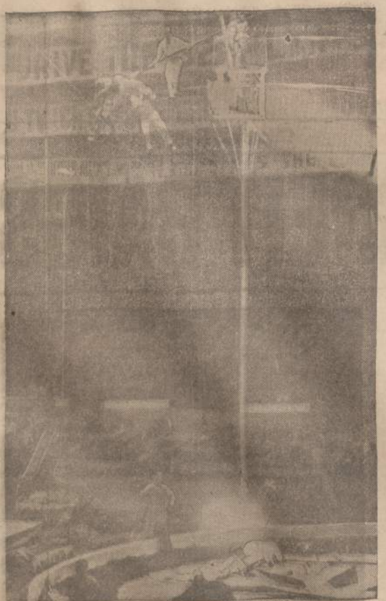
Detroit, Mich. — Shrine cirklo žiūrovai apstulbo, kai nukrito penki akrobatai, iš kurių du užsimušė, o kiti trys buvo sužeisti.

JEI NENORI ATSIKILTI NUO PASAULIO ĮVYKIŲ — SKAITYK "NAUJENAS" — JOS TEIKIA GERIAUSIAS, TEISINGIAUSIAS ŽINIAS