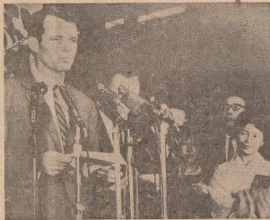
JAV prokuroras Robert Kennedy buvo labai entuziastingai sutiktas Tokijoe aerodrome nedidelės minios žmonių. Kennedy atvyko į Japoniją iš Honolulu (Havajų) kalpo geros valios ambasadorius.

HELSINKIS. — Pirmadienį ir antradienį suomia renka naują parlamentą, seniai perrinkus į prezidentus Dr. Urho Kekkonen, Suomijos-SSSR draugystės čempioną iš ūkininkų partijos. (Formaliai jis bus išrinktas vasario 15 dieną, suvažiu-