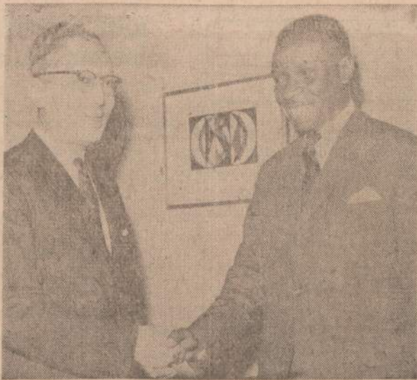
Kongo premjeras Cyrille Adoula (dešinėje), atvykęs į New Yorką, sveikina su Jungtinių Tautų gen. sekretorium U Thant. Jis atvyko į JT asmeniškai pranešti apie padėtį savo neramiame krašte.